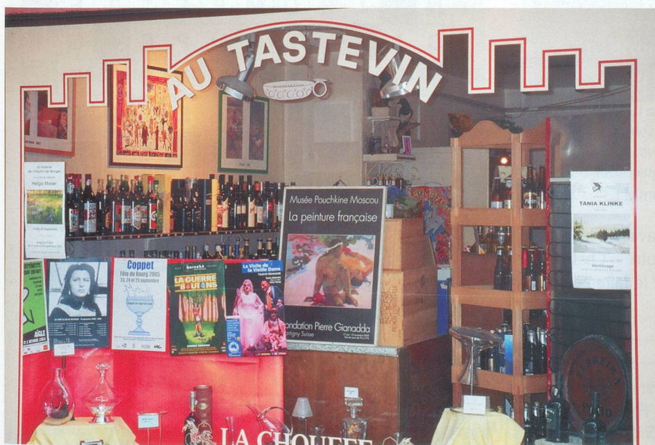
Au Tastevin, on trouve les crus les plus prestigieux.

Pizzeria de la Tour , avenue Marcellin 9, tél. 021 801 73 78.