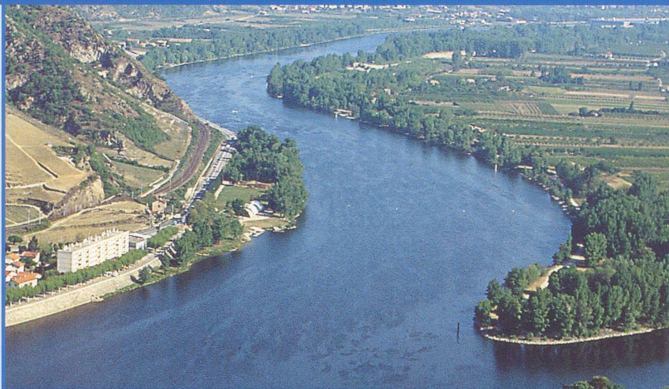
A bord du MS Camargue