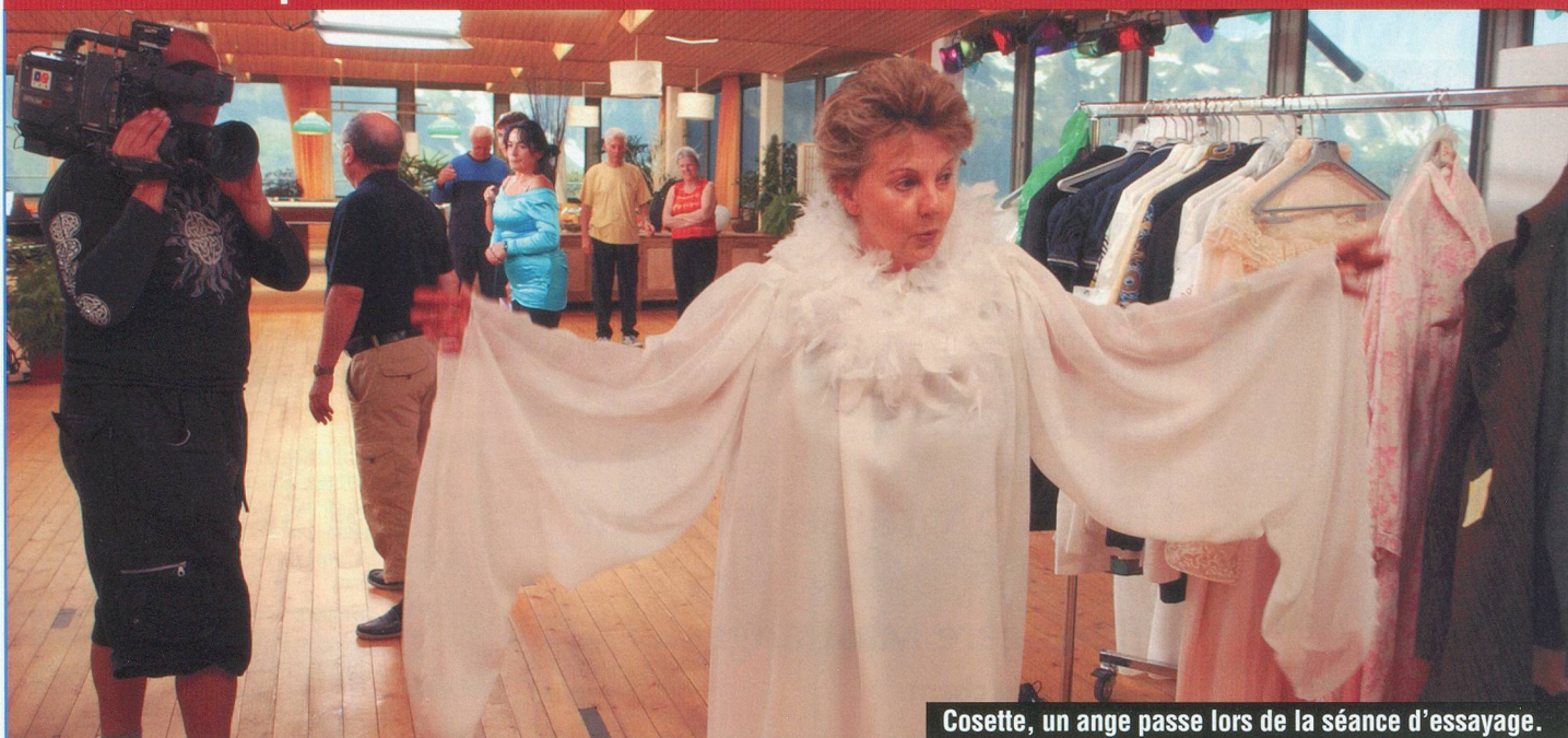
Cosette, un ange passe lors de la séance d'essayage.