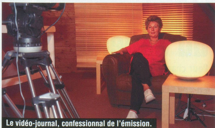
Le vidéo-journal, confessionnal de l'émission.