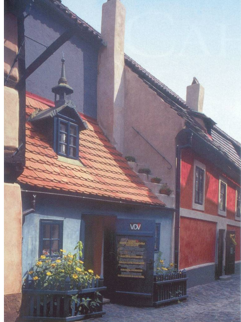
Un quartier pittoresque de Prague.

quer le Château de Prague, ancienne résidence des rois tchèques devenue la résidence présidentielle. On ne manquera pas