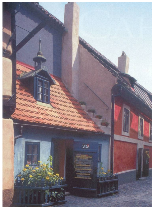
Un quartier pittoresque de Prague.

quer le Château de Prague, ancienne résidence des rois tchèques devenue la résidence présidentielle. On ne manquera pas