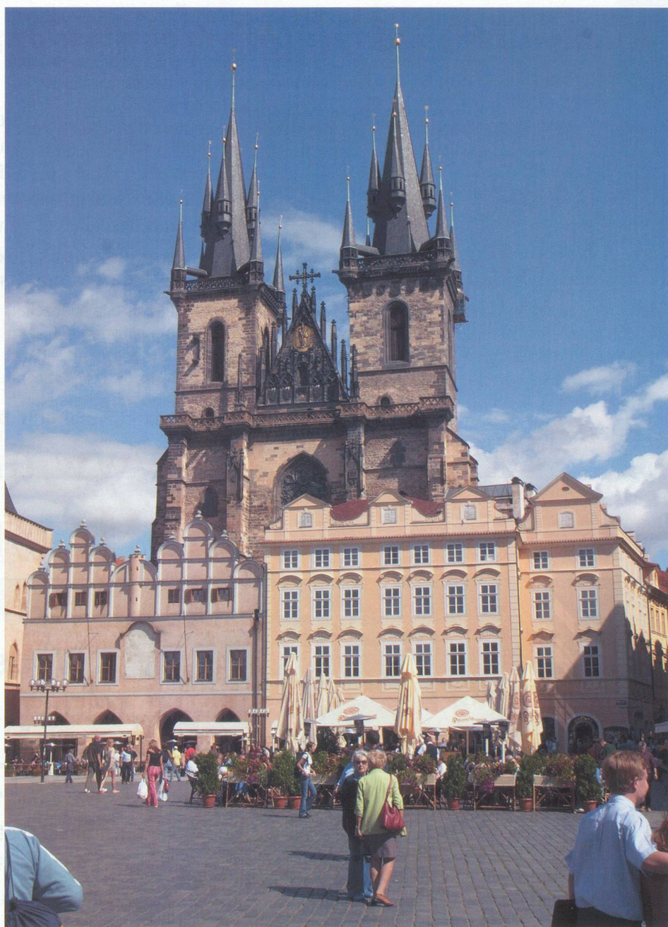
La place de la vieille ville dominée par la cathédrale.

Kafka, aussi, est toujours présent dans la ville qu'il ne quitta pratiquement jamais, sauf vers la fin de sa vie. Il y est d'ailleurs enterré. On retrouve à travers Prague les traces de cet écrivain, dont toute l'œuvre ne fait qu'illustrer et analyser le vain combat de l'individu contre des forces anonymes écrasantes. C'est le cas notamment dans la ruelle d'Or, véritable décor de poupées, qui abrite des petites maisons aux couleurs vives, construites au cours du 16 e siècle pour les gardes du roi Rodolphe II. On raconte que des alchimistes, sous la surveillance de ce roi auraient tenté d'y produire de l'or artificiel... Parmi ce patrimoine miraculeusement sauvegardé, intelligemment sauvegardé et mis en valeur, nous retiendrons encore le pont Charles qui enjambe la Vltava. Long de 515 mètres, large de 10 mètres, il invite à la rêverie, à condition d'y flâner, de très bonne heure le matin, à la lumière du soleil levant, sous le regard de nombreuses statues baroques de saints et même du compositeur Smetana. En hiver, sous un manteau de neige, il est tout aussi irrésistible.