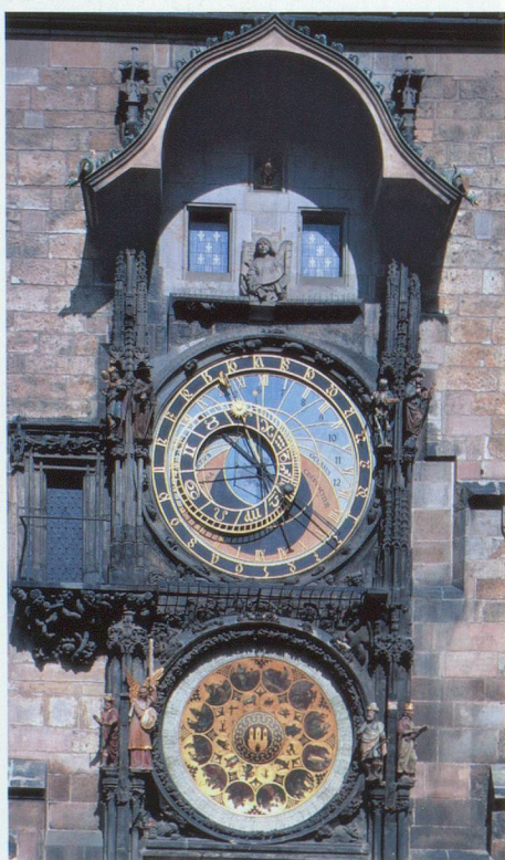
L'horloge astronomique de l'Hôtel de Ville.

Rêvons-nous? Sommes-nous dans une des plus anciennes villes d'Europe centrale ou tout simplement dans une métropole prospère et brillante? Nous sommes bel et bien à Prague, la plus grande ville de la République tchèque. Une cité résultant de la réunion de quatre villes médiévales, devenue, en moins d'une décennie, l'une des plus belles capitales d'Europe, ville phare du tourisme.