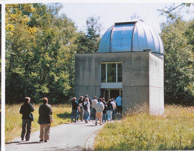
Des visiteurs pénètrent dans l'observatoire de Sauvigny.