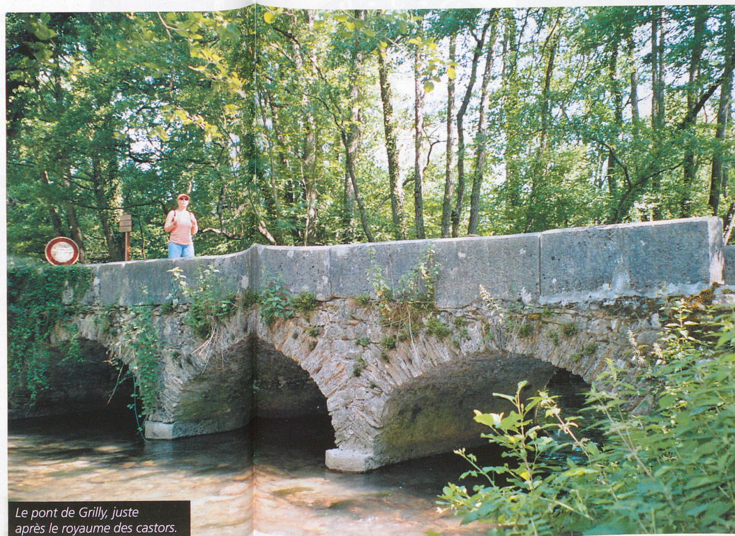
Le pont de Grilly, juste après le royaume des castors.

Plusieurs itinéraires pédestres transfrontaliers permettent de découvrir la Versoix après le tronçon sauvage et marécageux