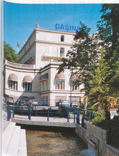
La Divonne canalisée au pied du casino.

Dès lors, la Versoix prend des allures moins farouches et moins sauvages. Elle coule doucement, sur quelques kilomètres, pour devenir «civilisée» aux abords de la commune de Sauverny, qui est à cheval sur la frontière. Quelques couples de colverts barbotent joyeusement sous le pont, avant de se laisser glisser vers La Bâtie. Ce tronçon, abondamment ombragé, fait le bonheur des marcheurs, mais également des cavaliers, qui trouvent ici un cadre idéal