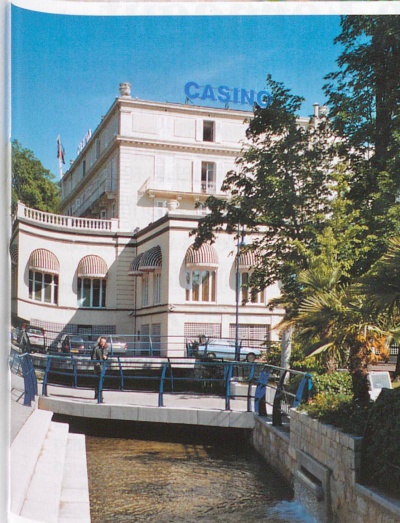
La Divonne canalisée au pied du casino.

Dès lors, la Versoix prend des allures moins farouches et moins sauvages. Elle coule doucement, sur quelques kilomètres, pour devenir «civilisée» aux abords de la commune de Sauvigny, qui est à cheval sur la frontière. Quelques couples de colverts barbotent joyeusement sous le pont, avant de se laisser glisser vers La Bâtie. Ce tronçon, abondamment ombragé, fait le bonheur des marcheurs, mais également des cavaliers, qui trouvent ici un cadre idéal