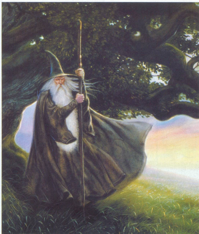
Sophisticated Games, Cambridge

Le monde du Seigneur des Anneaux vu par John Howe.