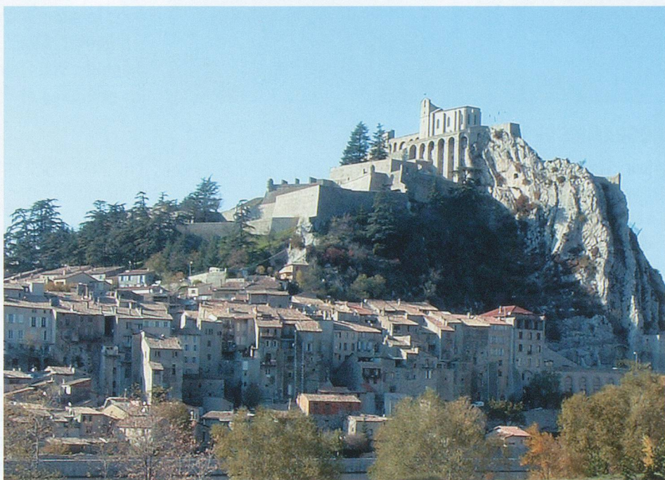
Des excursions, ici à Sisteron, pour les informaticiens en herbe.