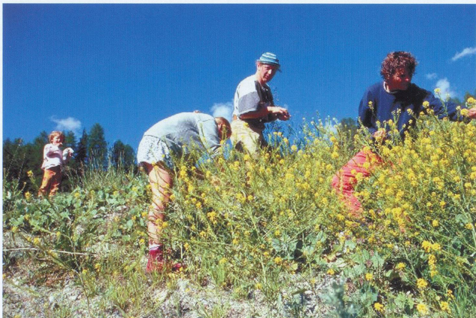
Des plantes sauvages en vue d'un bon repas.