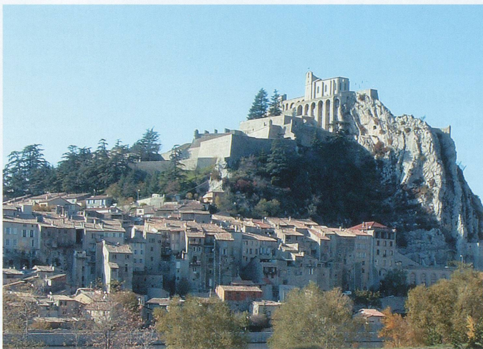
Des excursions, ici à Sisteron, pour les informaticiens en herbe.