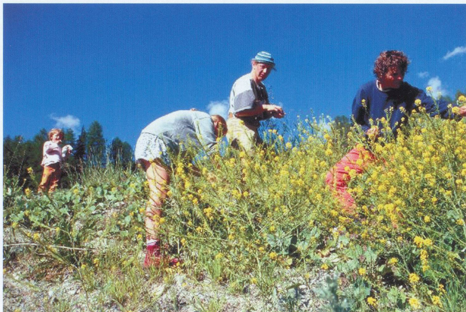
Des plantes sauvages en vue d'un bon repas.