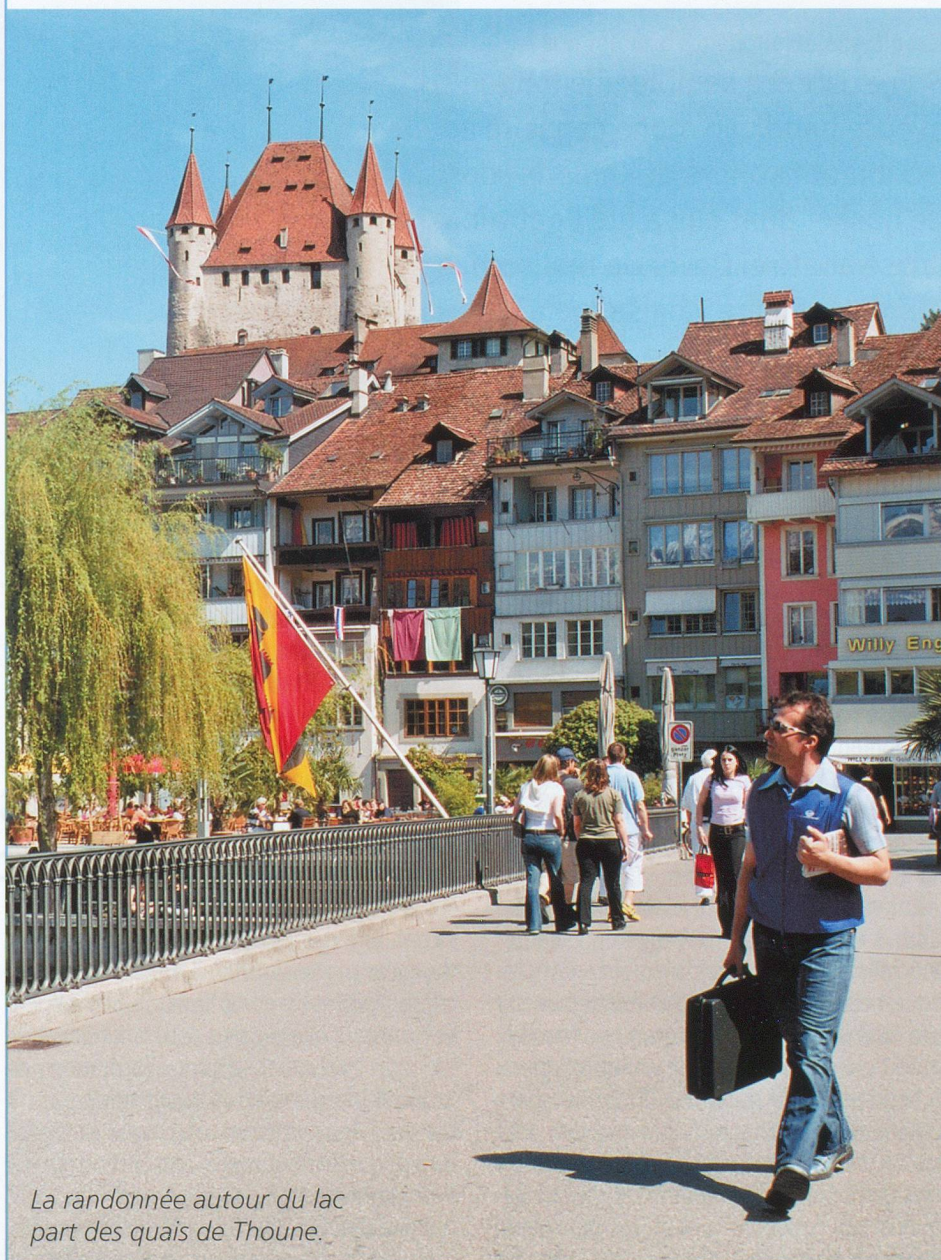
La randonnée autour du lac part des quais de Thoune.

» Rens. et inscriptions: Office du tourisme de Thoune, tél. 0842 842 11, voir aussi www.thunersee.ch