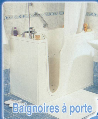
Baignoires à porte