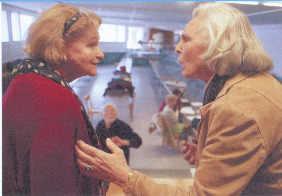
Les Pipelettes en pleine répétition.