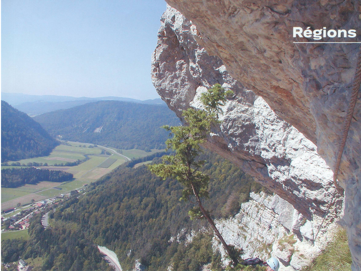
Le Val-de-Travers, une région méconnue qui mérite que l'on s'y arrête.