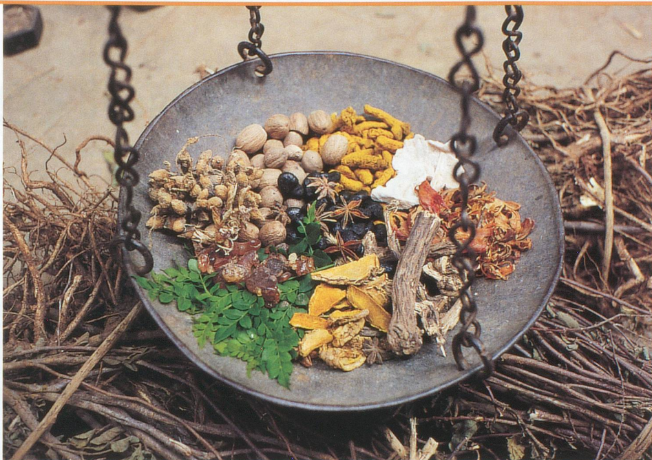
Les plantes utilisées comme remèdes sont pesées soigneusement.

» Tiré de: Le Livre de l'Ayurveda, le Guide personnel du Bien-Etre , Judith Morrison, Editions Le Courrier du Livre.