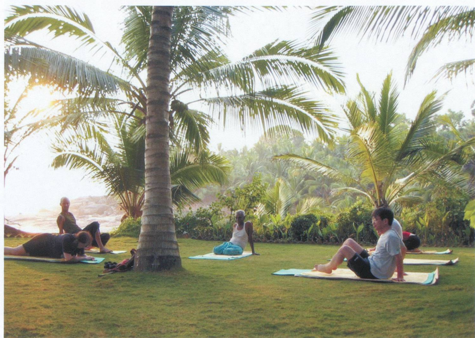
Séance de yoga pour les curistes au Kerala.

Vata, ou l'air et l'éther, est associé à ce qui est extrême, irrégulier, petit, sec ou léger. Le physique de la personnalité Vata a les caracté-