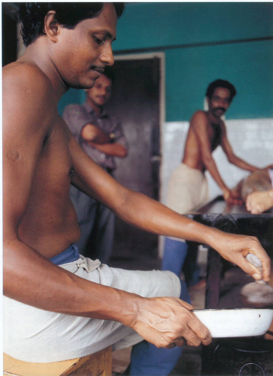
Au Kerala, en Inde, les spécialistes préparent les huiles de massage.

■ L'exposition Mednat à Lausanne accueille les médecines asiatiques en invitées d'honneur. Une occasion de faire connaissance avec des savoirs millénaires qui intéressent de plus en plus les Occidentaux.