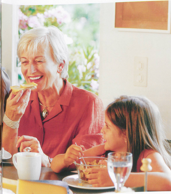
Organisation fromagère suisse OFS

Le combat pour l'obtention de l'AOC risque d'être long pour les producteurs de «Raclette