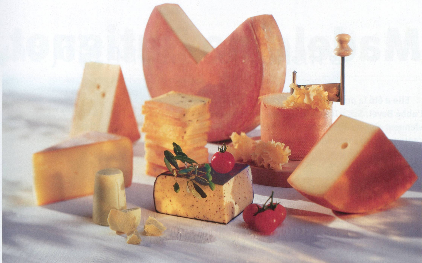
Organisation fromagère suisse OFS

Des 27 000 tonnes de gruyère produites chaque année, le tiers est exporté, principalement aux Etats-Unis, en Allemagne, en France, en Italie et en Espagne. Le « meilleur fromage du monde » a conquis la planète. En douceur et en saveur.