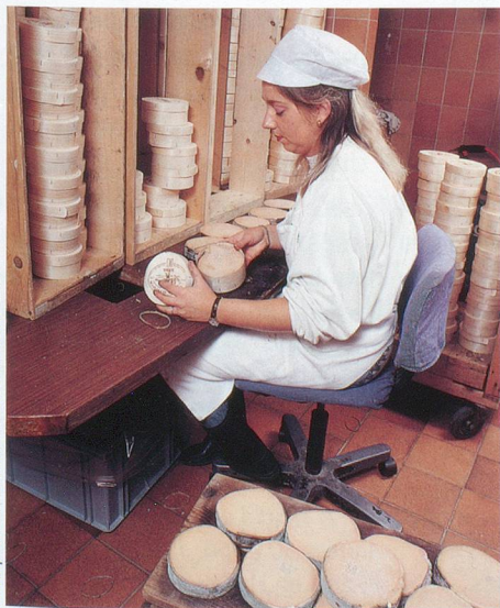
Interprofession du Vacherin Mont-d'Or

Les traditions de fabrication du Sbrinz remontent très loin dans le temps et se sont transmises au fil des générations. Aujourd'hui, ce fromage à la saveur soutenue se consomme de trois façons: en petits morceaux brisés, râpé directement sur les plats chauds ou – plus souvent – raboté en rebibes à l'heure de l'apéritif.