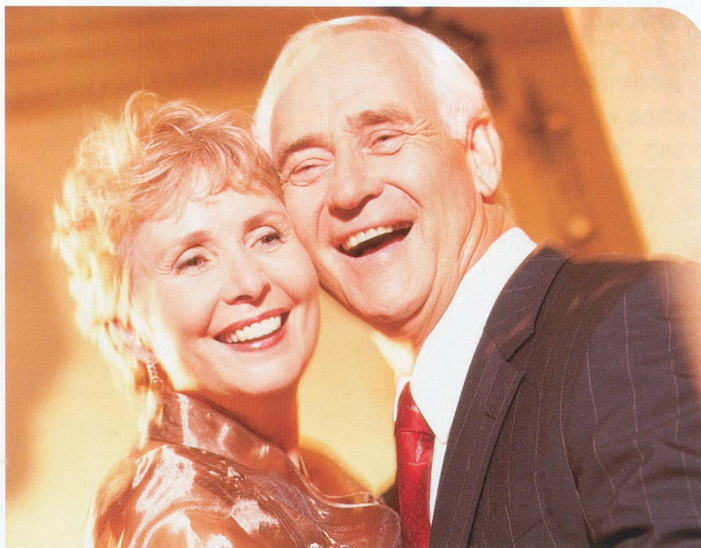
Thé-dansant à la salle communale de Founex (VD), mardi 17 février, de 14 h à 17 h. Rens.: 022 776 82 47.

L'ESCALE – Repas, dimanche 1 er et 22 février. Loto, mercredi 4 février. «La Corse», film, jeudi 12 février à 14 h 15. «Les Lagons aux épices», diaporama, jeudi 26 février, 14 h 15. Excursion: la Revue de Servion, dimanche 1 er février, à 14 h. Marches, mardis 10, 17 et 24 février. Cours d'entraînement de la mémoire,