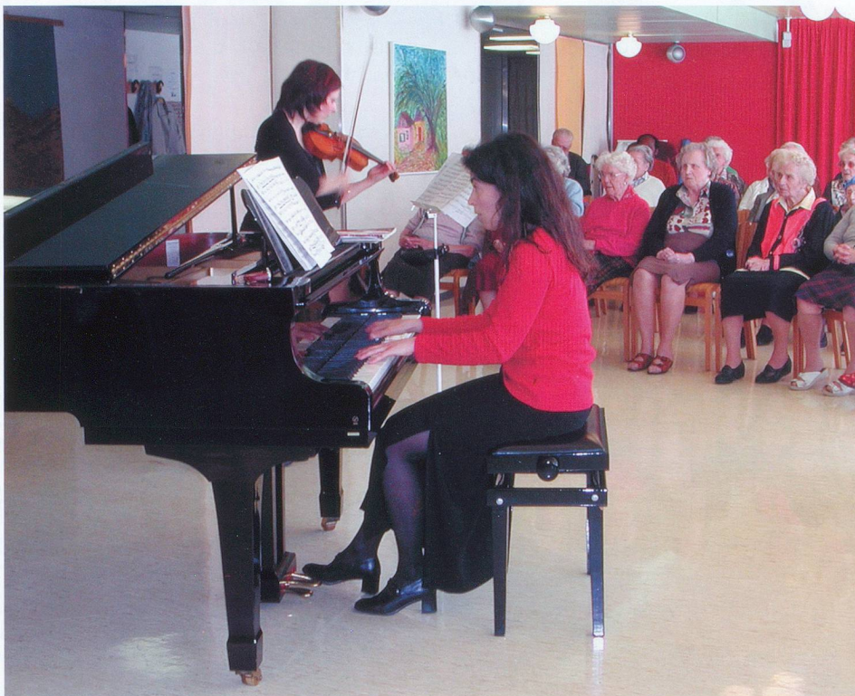
Animation musicale au foyer de l'EMS Mont-Calme, à Lausanne.