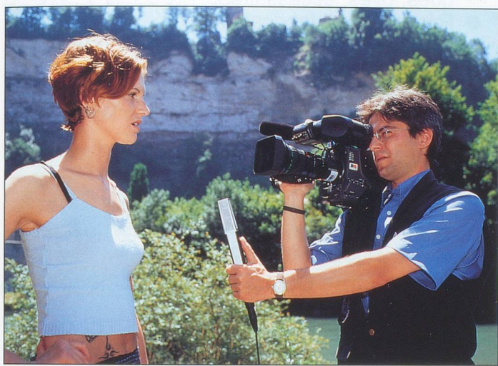
Nous sommes nés bien avant la télévision...

■ Ce texte nous a été envoyé par un lecteur de La Tour-de-Peilz. Il nous a semblé parfaitement adapté à notre époque épique.