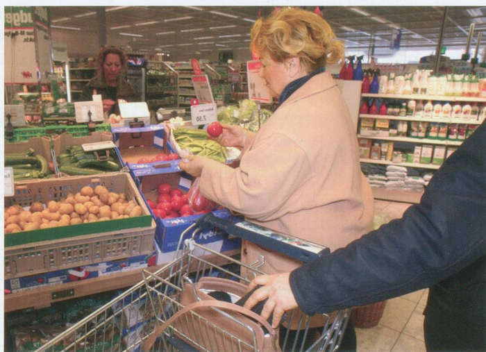
Prévention suisse de la criminalité, Neuchâtel