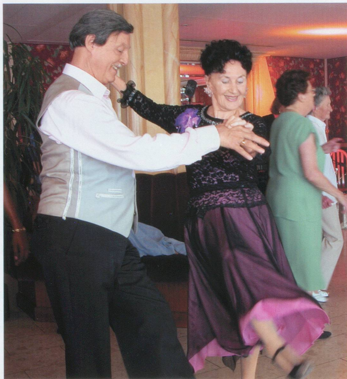
Les danseurs retrouvent leurs vingt ans.

Véritables phénomènes de société, les thés dansants se multiplient à travers nos régions. Il manque pourtant un élément essentiel afin que le bonheur soit total. Où trouver les cavaliers qui feront valser ces dames?