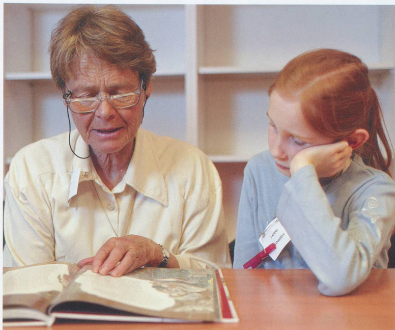
Lire et écouter une histoire: deux plaisirs partagés.