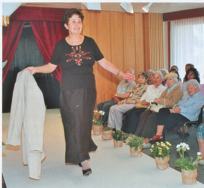
Longue jupe noire et petit pull à impressions colorées, un ensemble à porter en toute occasion.

»»» Home médicalisé de Clos-Brochet, rue Clos-Brochet 48, 2000 Neuchâtel, tél. 032 722 71 00.