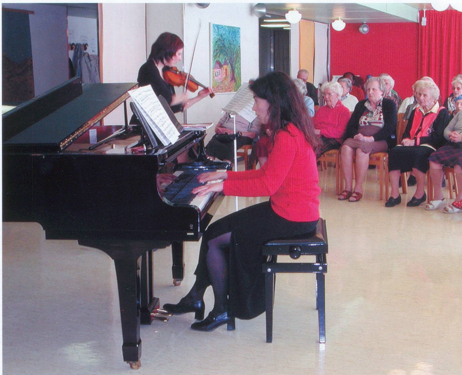
Animation musicale au foyer de l'EMS Mont-Calme, à Lausanne.