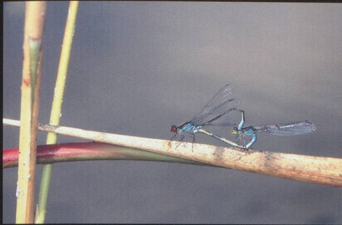
Une co-édition Musée Cantonal de Zoologie de Lausanne et Daniel Aubort Editions