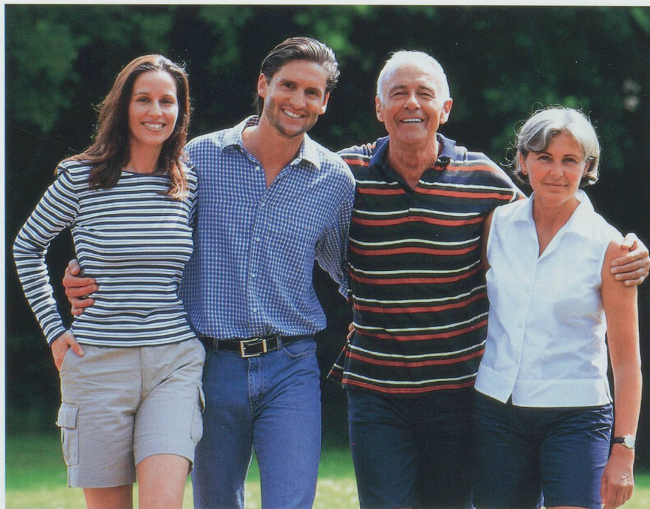
Communiquer plus rapidement, mieux s'entendre – grâce à Siemens Triano.

Triano introduit de nouvelles optimisations dans le domaine de l'adaptation fine, du confort d'adaptation et de la gestion de l'acclimatation, l'élément clé pour l'acceptation d'un nouvel appareil auditif.