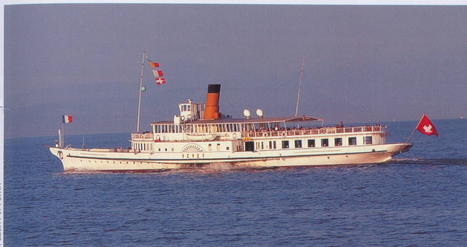
P. Latin / J. Perrin

Avec le retour des beaux jours, nous vous invitons à effectuer une croisière sur les lacs de Suisse romande.