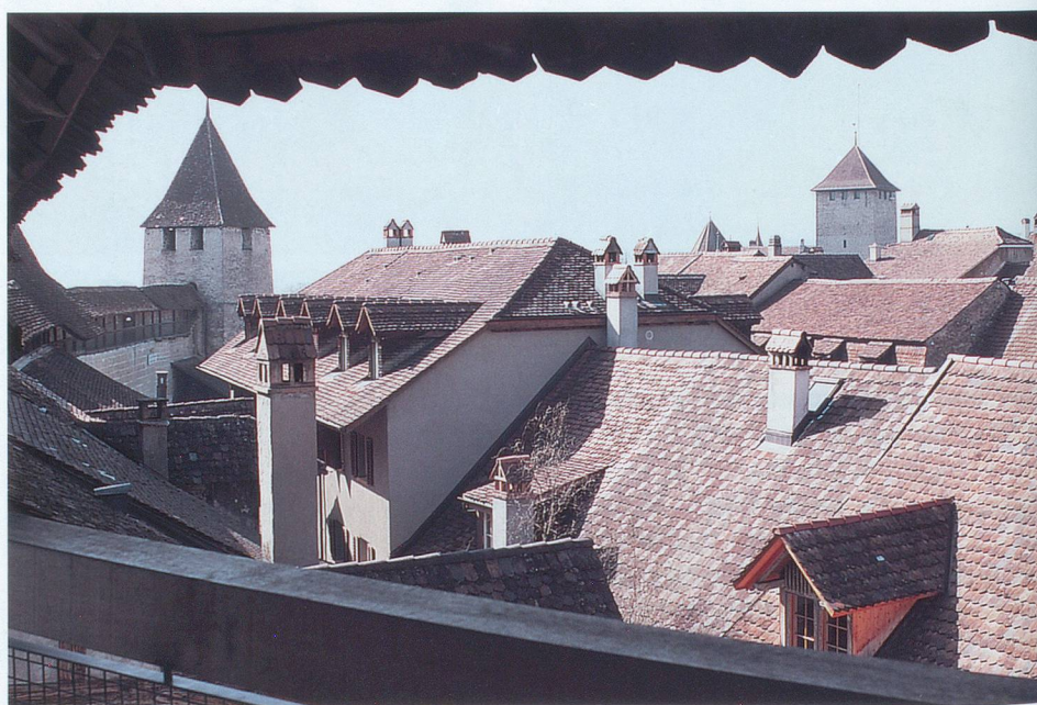
Tuiles et cheminées vues des remparts.