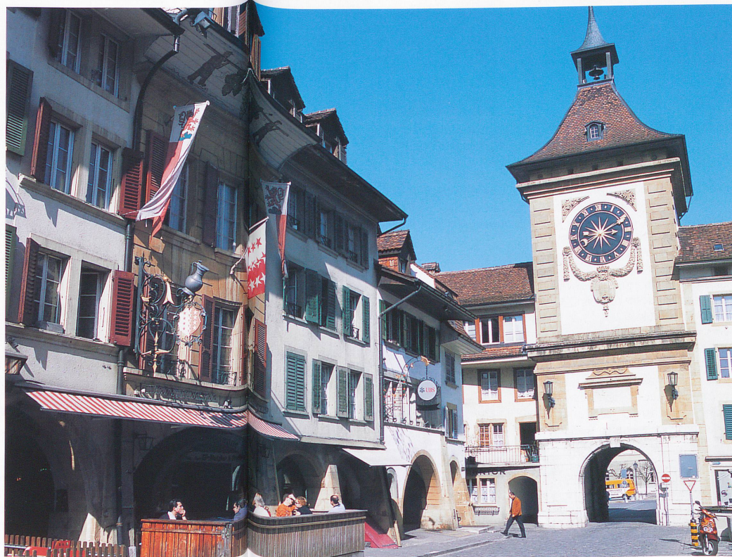
La Tour de Berne, emblème de la cité, rappelle que Morat est proche parente de la ville fédérale.

Un chemin de ronde, à l'extérieur des remparts, presque caché, au-dessus des jardins familiaux logés dans le fossé, nous conduit, par la Törliplatz, à la promenade des rem-