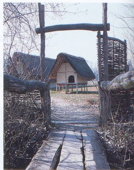
Reconstitution d'un village du néolithique à Gletterens.

Un sentier pédestre relie Morat à Sugiez, de l'autre côté du lac, par la forêt du Chablais. L'ascension du Vully, petite colline qui culmine à 653 mètres, n'est pas très difficile. Depuis les villages de Praz ou Môtier, on atteint le sommet en moins d'une heure. Mais