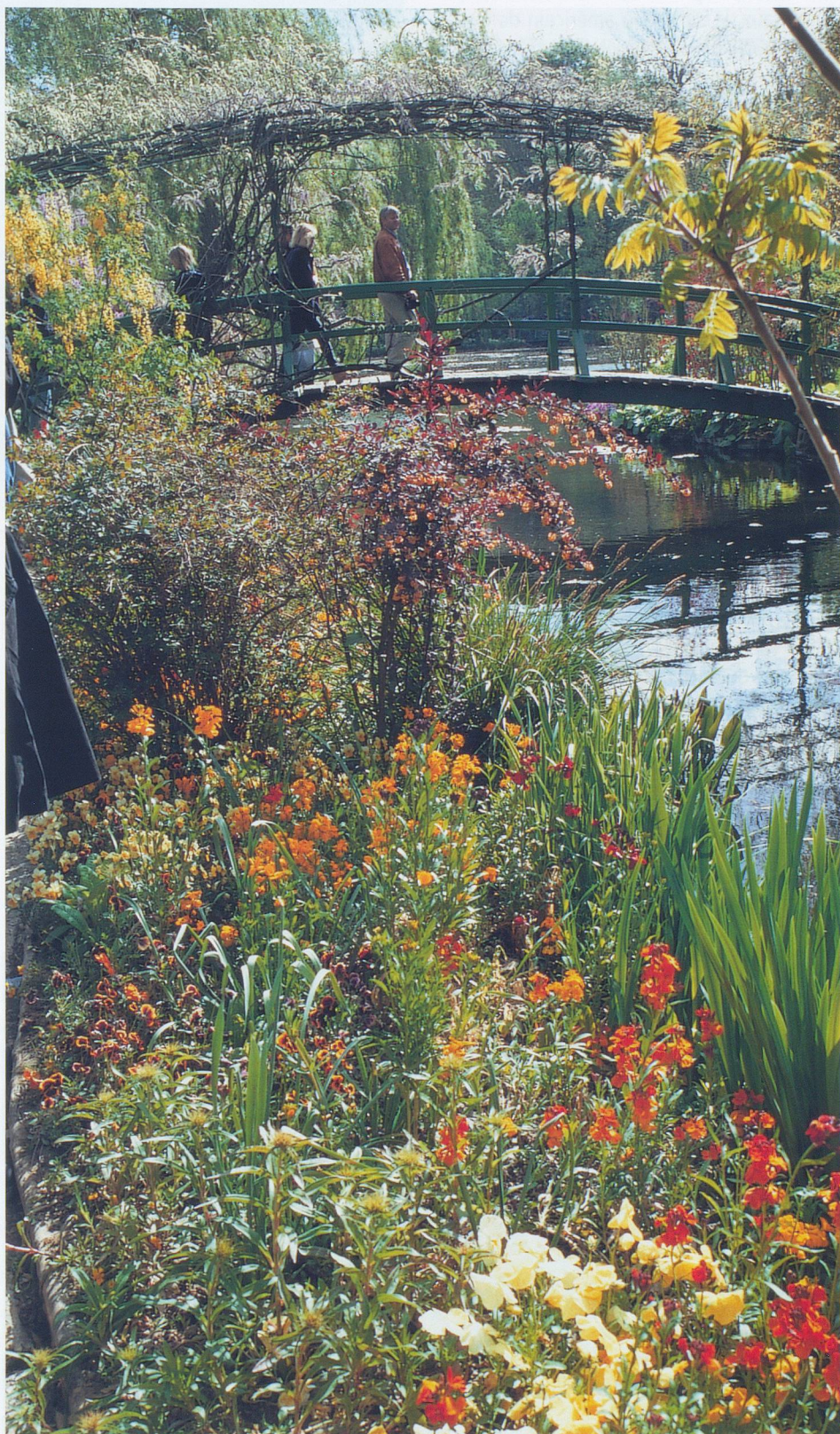
Le célèbre étang aux nymphéas de Monet à Giverny.

Le Débarquement débuta dans la nuit du 5 au 6 juin, par un bombardement intense des positions allemandes. Trois divisions de parachutistes prirent ensuite position à Sainte-Mère-Eglise (Américains) et à Ranville