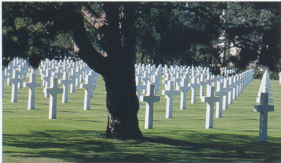
Les impressionnantes alignées de croix du cimetière américain de Colleville.