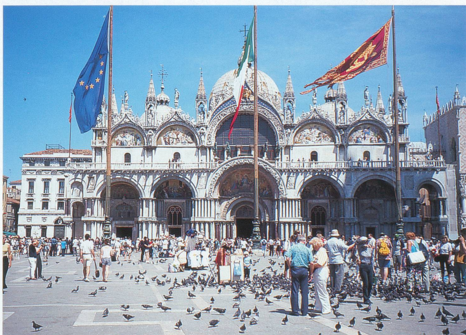
De nombreux pigeons hantent la place Saint-Marc.

Les rues de Venise ont pour agréable particularité d'être piétonnières, les transports urbains étant essentiellement assurés par des bateaux de tous calibres, qui font ronfler leurs moteurs, fort heureusement dans la lagune ou sur le grand Canal. Les légendaires gondoles sont des éléments certes décoratifs, mais, après tout, bien agréables pour qui veut flâner en paresseux. La meilleure manière de visiter Venise reste celle de parcourir à pied le dédale des ruelles et de découvrir de véritables tableaux artistiques comme, par exemple, ici une petite place arborisée, là un atelier de peinture sur poterie, là encore un ponton avec une enfilade de gondoles, etc.