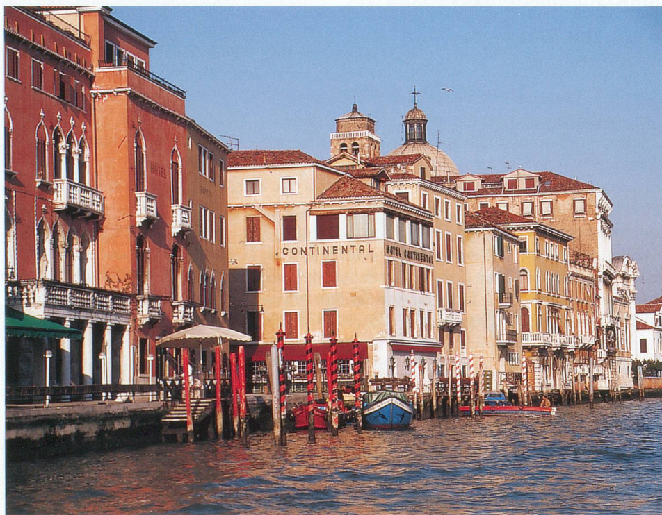
Les palais vénitiens que l'on admire en longeant le Grand Canal.

Dès lors, la domination expansionniste de Venise ne cessa de croître avec les intégrations terrestres de la côte dalmate, de Gênes,