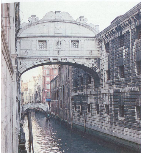
Le célèbre pont des Soupirs.

les plus belles toiles des prestigieux artistes que sont Titien, le Tintoret, Tiepolo, Carpaccio et Véronèse. Les autres sites où l'on peut aussi admirer les grandes toiles vénitiennes sont, par exemple, la Scuola Grande di San Rocco, la Scuola San Giorgio degli Schiavoni et l'ancienne église paroissiale du Tintoret qui porte le nom de Madonna Dell'Orto.