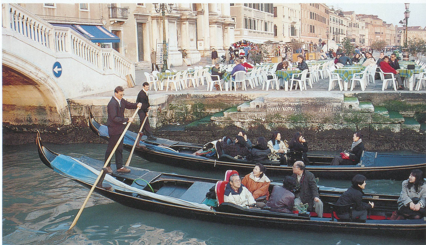
Une balade à bord des légendaires gondoles demeure très romantique.

L'Académie est le second must de Venise; c'est ici que se trouvent réunies, entre autres,