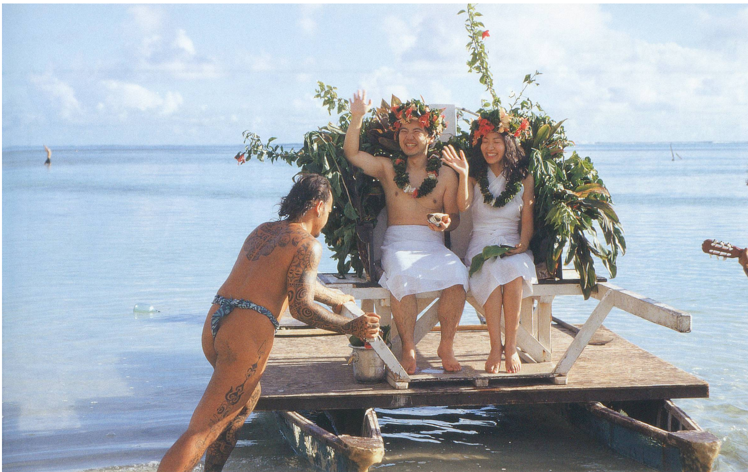
Mariage traditionnel à Moorea (Polynésie).