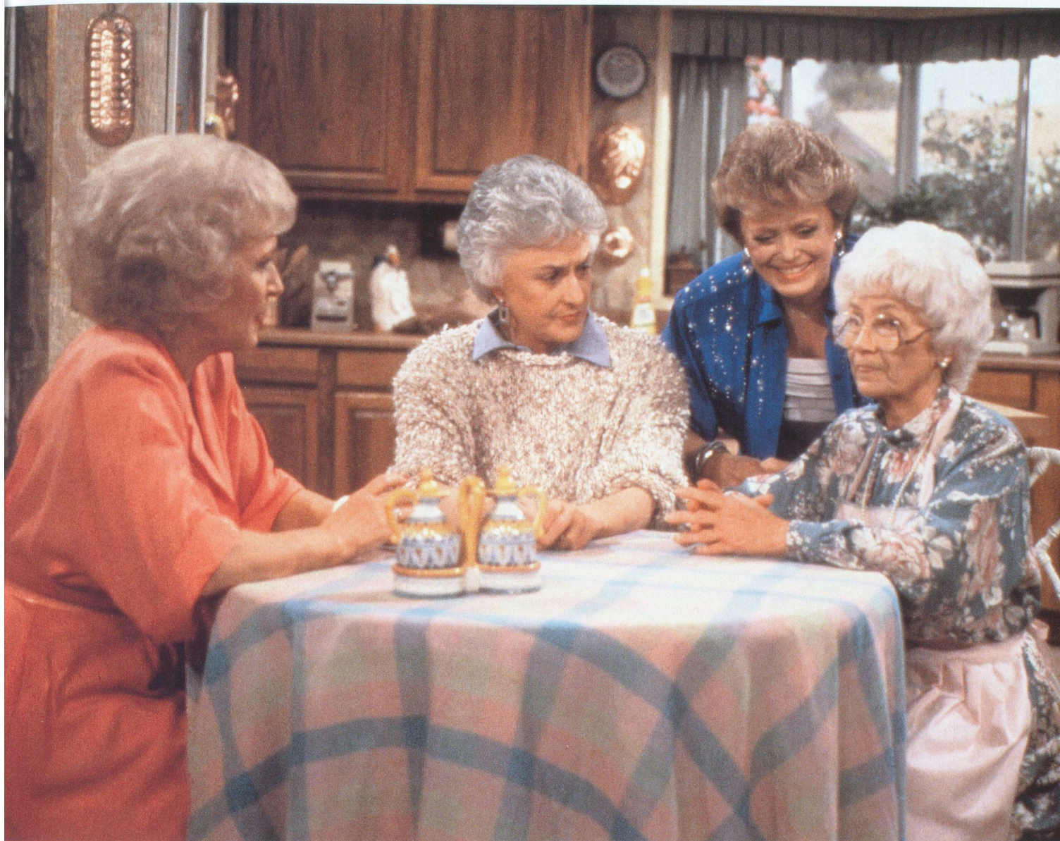
Les Craquantes: une série TV qui illustre bien les joies et les aléas de l'amitié.