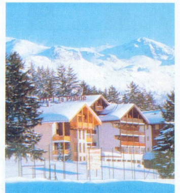
Hôtel La Prairie, à Montana

Côte d'Azur - Cap Soleil , 3 pièces/6 personnes, loggia, lave-linge, lave-vaisselle, téléphone, télévision, coffre-fort, vue + accès mer, piscine, tennis, site exceptionnel, dès Fr. 395.-. Tél. 022 792 79 92.