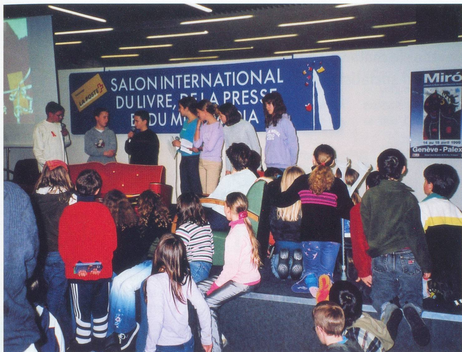
Remise du Prix Chronos – Pro Senectute 2002.

attirés par cette thématique. Il arrive aussi que certains ouvrages rallient les suffrages des deux jurys; c'est ainsi que, cette année, le roman de Xavier-Laurent Petit, publié en 2002 chez Flammarion, cumule les prix décernés par les juniors et les seniors.