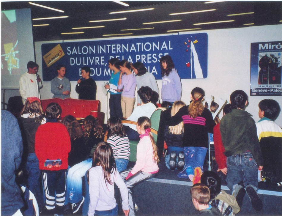
Remise du Prix Chronos – Pro Senectute 2002.

attirés par cette thématique. Il arrive aussi que certains ouvrages rallient les suffrages des deux jurys; c'est ainsi que, cette année, le roman de Xavier-Laurent Petit, publié en 2002 chez Flammarion, cumule les prix décernés par les juniors et les seniors.