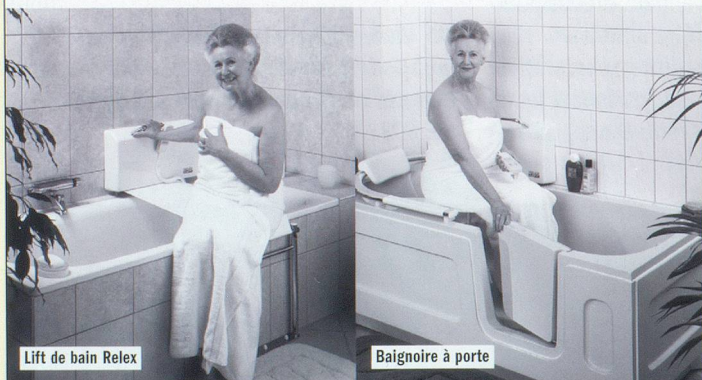
Lift de bain Relex