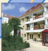
Résidences en Ville Morges