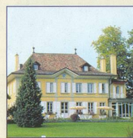
Domaine de la Gottaz - Morges