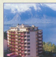
Résidence Le Bristol**** Montreux-Territet