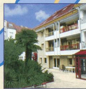
Résidences en Ville Morges

Envoyez-moi une documentation concernant :