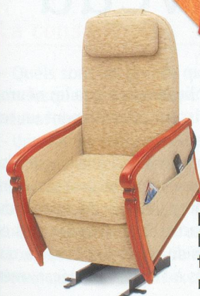
NOUVEAU Modèle: Louvre fauteuil releveur