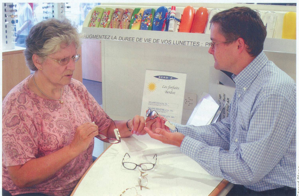
Le choix des montures de lunettes personnalisées est important.

Le moins cher possible. Très rares sont les opticiens qui parviennent à vous offrir des verres au prix correspondant au remboursement de la caisse maladie, soit Fr. 200.- tous les cinq ans. Certaines grandes chaînes proposent des forfaits pour des lunettes «bas de gamme» avec des montures dès Fr. 20.-. «Impossible de vendre une monture qui tienne le coup», disent les uns. «Elles sont parfaitement solides et, d'ailleurs, nous les garantissons», affirment les autres. Et ceux-là mêmes d'ajouter «elles sont, bien sûr, moins élégantes, plus ordinaires et, parfois, ce sont des fins de série, mais de bonnes lunettes quand même». Pourtant, il n'est pas rare que ceux qui vendent des lunettes à forfait fassent