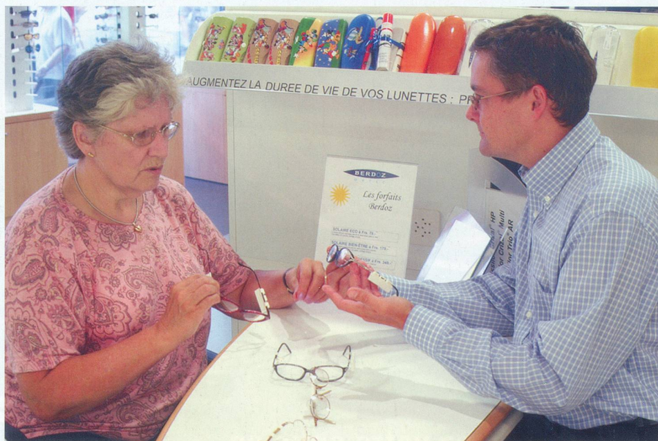
Le choix des montures de lunettes personnalisées est important.

Le moins cher possible. Très rares sont les opticiens qui parviennent à vous offrir des verres au prix correspondant au remboursement de la caisse maladie, soit Fr. 200.- tous les cinq ans. Certaines grandes chaînes proposent des forfaits pour des lunettes «bas de gamme» avec des montures dès Fr. 20.-. «Impossible de vendre une monture qui tienne le coup», disent les uns. «Elles sont parfaitement solides et, d'ailleurs, nous les garantissons», affirment les autres. Et ceux-là mêmes d'ajouter «elles sont, bien sûr, moins élégantes, plus ordinaires et, parfois, ce sont des fins de série, mais de bonnes lunettes quand même». Pourtant, il n'est pas rare que ceux qui vendent des lunettes à forfait fassent