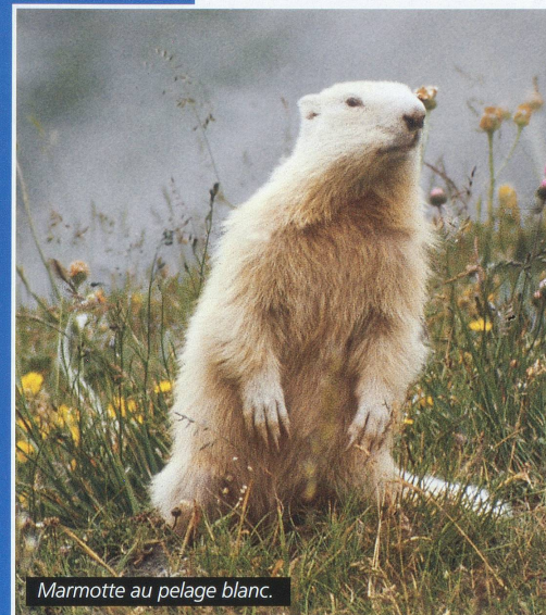
Marmotte au pelage blanc.