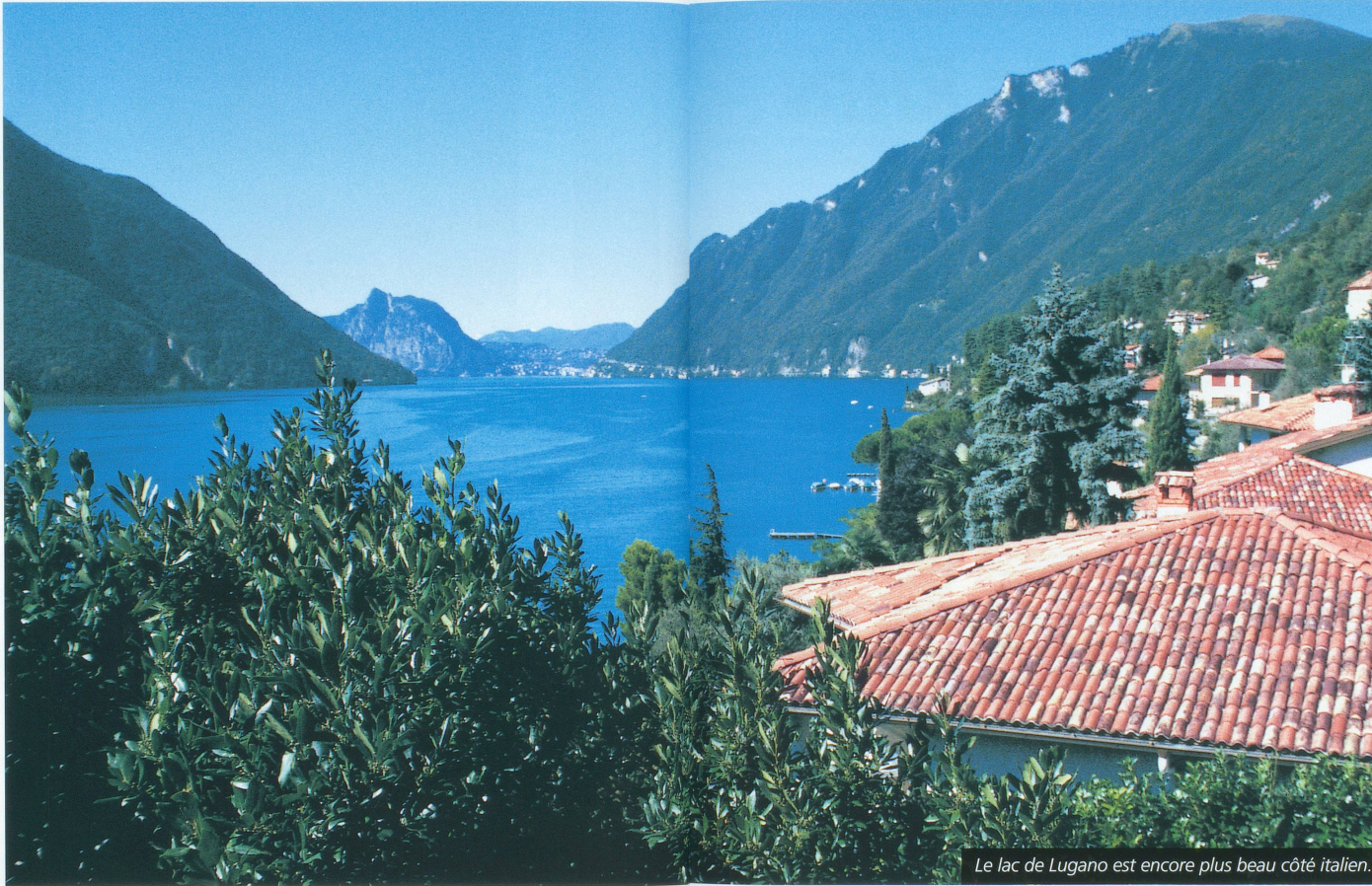
Le lac de Lugano est encore plus beau côté italien.

■ Il faut parfois savoir changer radicalement dans ses habitudes de conducteur et échapper aux grands axes autoroutiers. Il faut alors prendre le temps d'admirer les paysages, de se trouver une bonne petite auberge qui vous servira des spécialités locales, de visiter des sites hors des heures d'affluence... Voici quatre suggestions de lieux souvent ignorés.