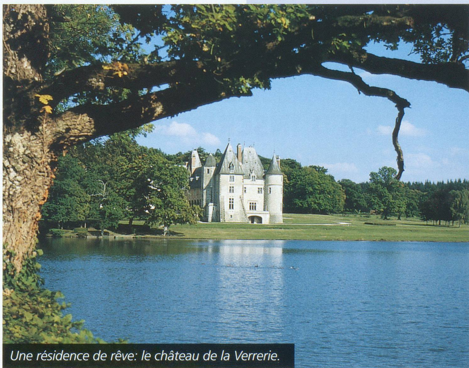
Une résidence de rêve: le château de la Verrerie.

Vorarlberg: le Caruso à Dornbirn, tél. 0043/5572 23379.