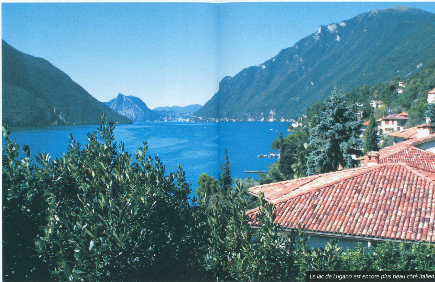
Le lac de Lugano est encore plus beau côté italien.

■ Il faut parfois savoir changer radicalement dans ses habitudes de conducteur et échapper aux grands axes autoroutiers. Il faut alors prendre le temps d'admirer les paysages, de se trouver une bonne petite auberge qui vous servira des spécialités locales, de visiter des sites hors des heures d'affluence... Voici quatre suggestions de lieux souvent ignorés.