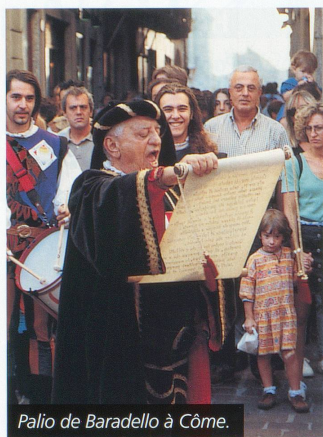
Palio de Baradello à Côme.