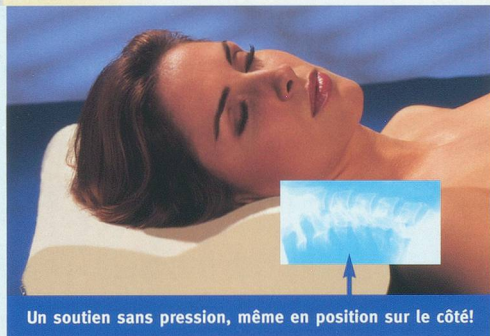
Un soutien sans pression, même en position sur le côté!

Un soutien optimal de votre colonne vertébrale se traduit par un sommeil sain, sans courbatures.