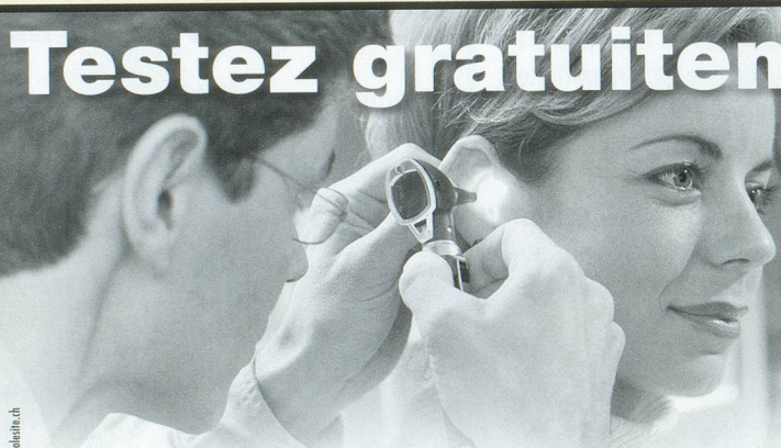
001 - www.dsh.ch

Petit-Chêne 38 - CH-1003 Lausanne Tél. 021 323 49 33 - Fax 021 323 49 34 - oberdoz@freesurf.ch