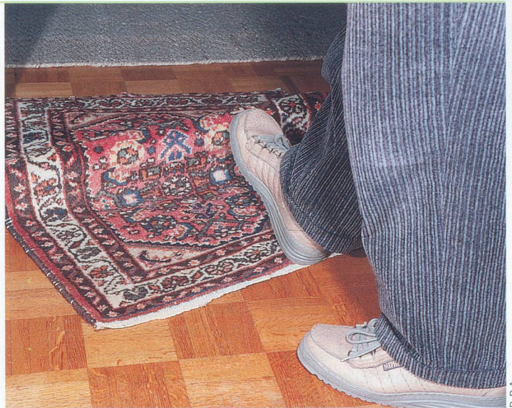
Un tapis mal posé, et c'est la chute assurée!

Comment faire concrètement pour s'aider soi-même ou aider l'autre? «Pour commencer, explique M me Dubrit, il y a lieu de faire un bilan de ce que la personne peut faire et de ce qu'il faut modifier. Ensuite, il s'agit de pratiquer activement et consciemment les mouvements de la vie quotidienne: effectuer sa toilette et s'habiller, préparer les repas, faire son lit, descendre et monter les escaliers au lieu de prendre