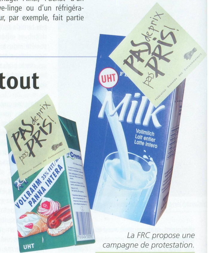
La FRC propose une campagne de protestation.