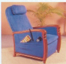
Revêtement MI 701