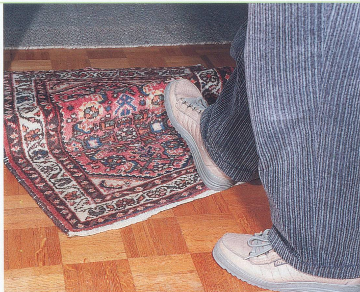
Un tapis mal posé, et c'est la chute assurée!

Comment faire concrètement pour s'aider soi-même ou aider l'autre? «Pour commencer, explique M me Dubrit, il y a lieu de faire un bilan de ce que la personne peut faire et de ce qu'il faut modifier. Ensuite, il s'agit de pratiquer activement et consciemment les mouvements de la vie quotidienne: effectuer sa toilette et s'habiller, préparer les repas, faire son lit, descendre et monter les escaliers au lieu de prendre