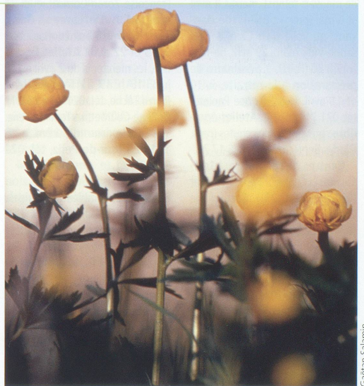
Trolls ou boutons d'or, une plante d'altitude.

Andrée Fauchère propose un programme dont l'objectif est de