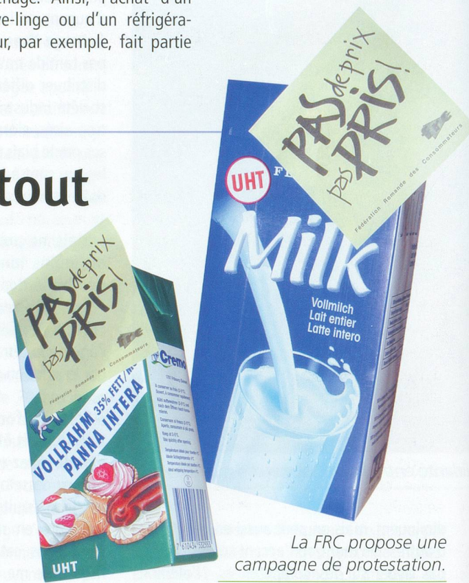
La FRC propose une campagne de protestation.