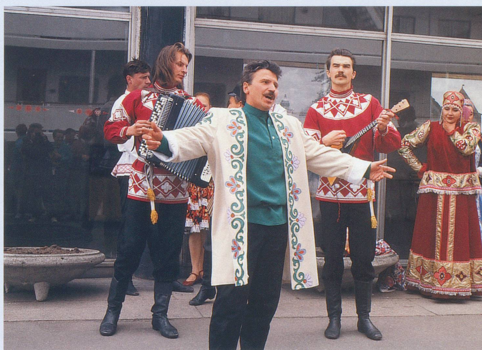
Les orchestres de rue, avec accordéon et balalaïka, accompagnent les passants.

bre double dans un hôtel***, repas et excursions selon programme, service d'un guide parlant français, transport en car. (Non compris: visa, assurance annulation obligatoire, boissons et dépenses personnelles.)