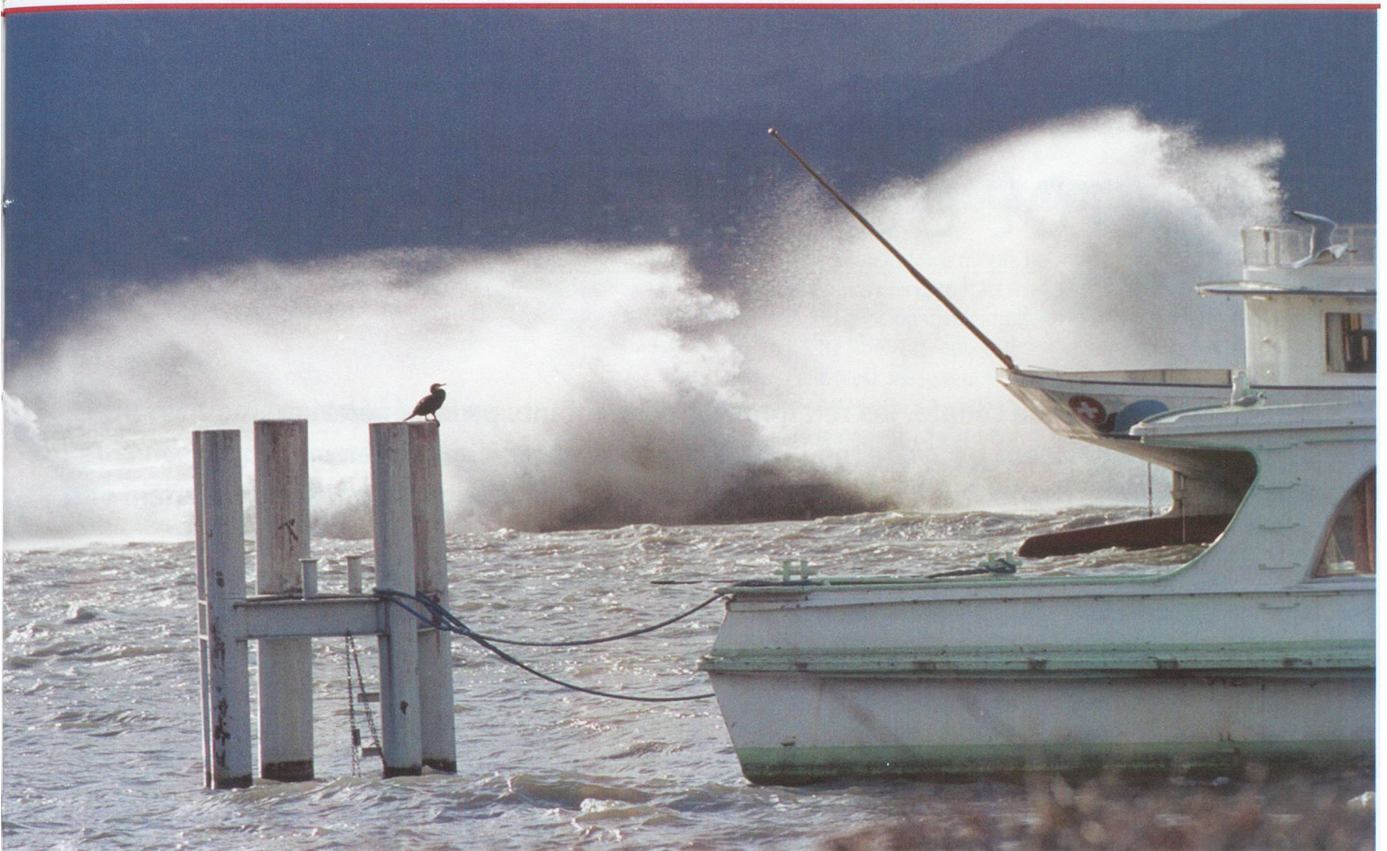
Décembre 1999, tempête sur le Léman au passage de Lothar.

suisses sont un exemple formidable d'énergie complètement renouvelable. Il y en a d'autres – le solaire, l'énergie éolienne – qui méritent d'être développées. A notre petit niveau, il s'agit par exemple de réfléchir à notre chauffage. Chaque degré économisé à l'intérieur des bâtiments est une bonne chose. Il vaut mieux, par exemple, mettre un pull plutôt que d'augmenter la température de l'appartement. Il faut aussi savoir que le tiers de l'énergie fossile utilisée en Suisse l'est pour nos déplacements. Nous devons donc nous demander chaque fois que l'on veut recourir à la voiture s'il n'y a pas d'autres moyens de se déplacer: à pied, à vélo, à trottinette ou en empruntant le train.