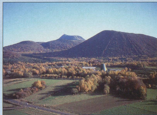
La chaîne des volcans d'Auvergne

Inclus dans le prix: voyage en car confortable non fumeur, 4 jours en demi-pension, 1 jour en pension complète, entrées et visites selon programme, accompagnant, documentation. (Non compris: assurances, frais de réservation, boissons et pourboires).