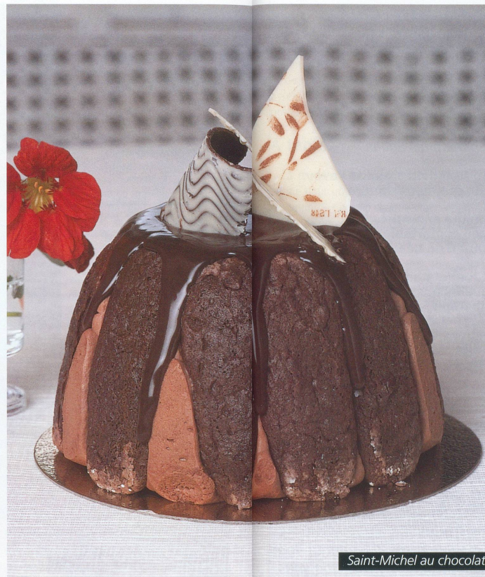
Saint-Michel au chocolat

Les conquistadors, emmenés par Cortez, ramenèrent cette boisson fortifiante en Espagne. On y ajouta du sucre pour en adoucir le goût et le chocolat partit à la conquête de l'Europe. Vers 1880, le chocolatier Cailler rencontra le fabricant de lait en poudre Nestlé.