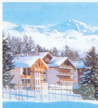
Hôtel La Prairie, à Montana.

dès le 4.01.03, Fr. 85.- par jour en 1/2 pension. Pension complète + Fr. 25.- par repas. Chambre individuelle en saison + Fr. 20.-. Repas valaisan sur demande, servi dans notre carnotzet «Le Chaudron». Situation tranquille, à proximité des pistes de ski de fond. Terrasse, ambiance familiale, cuisine soignée. Service de minibus privé. Pour vos réservations. Tél. 027 485 41 41 - fax 027 485 41 42.