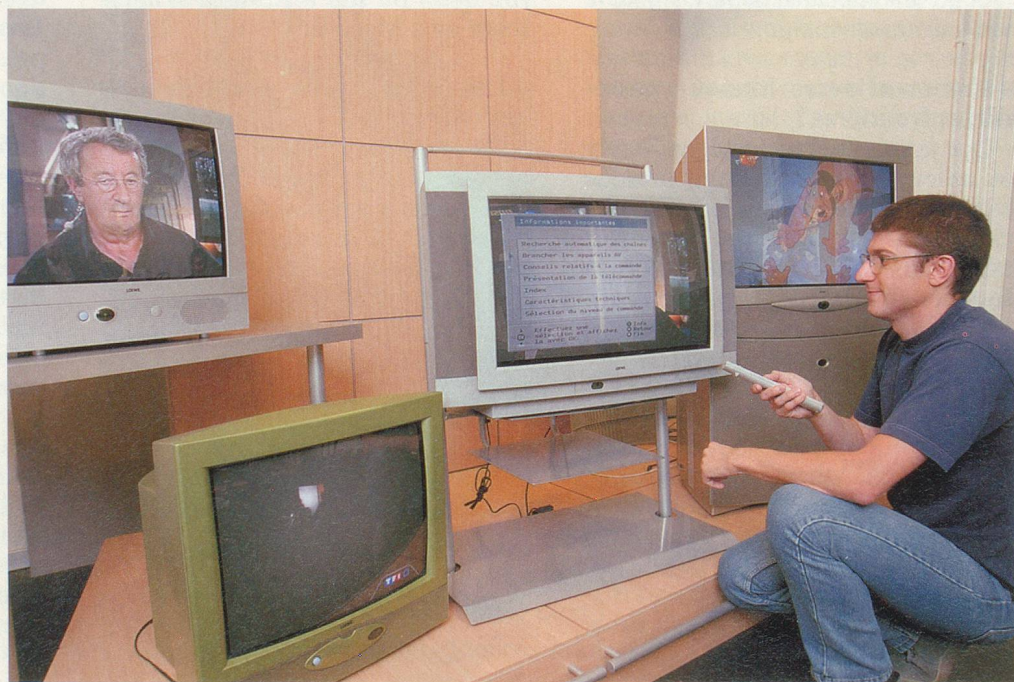
Les réglages de votre téléviseur sont l'affaire de professionnels

Cette remarque est valable pour les téléviseurs, mais aussi pour les enregistreurs vidéos et les lecteurs de DVD. «Les appareils vidéo comprenant la lecture et l'enregistrement de cassettes VHS coûtent moins de