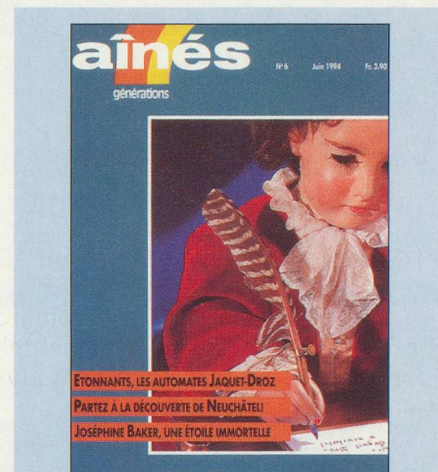
Numéro d'Aînés en 1994