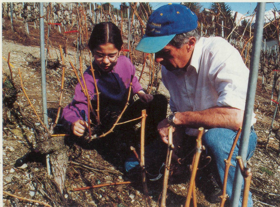
Anne-Do Zufferey / DR

Villa a donné son nom au manoir qui dresse sa gracieuse tour hexagonale sur fond de vignes et dont les dépendances agricoles prouvent son implantation dans le terroir. La partie la plus ancienne, édifiée par les Platea date du début du 16 e siècle, l'autre, bâtie par la famille de Preux, ►