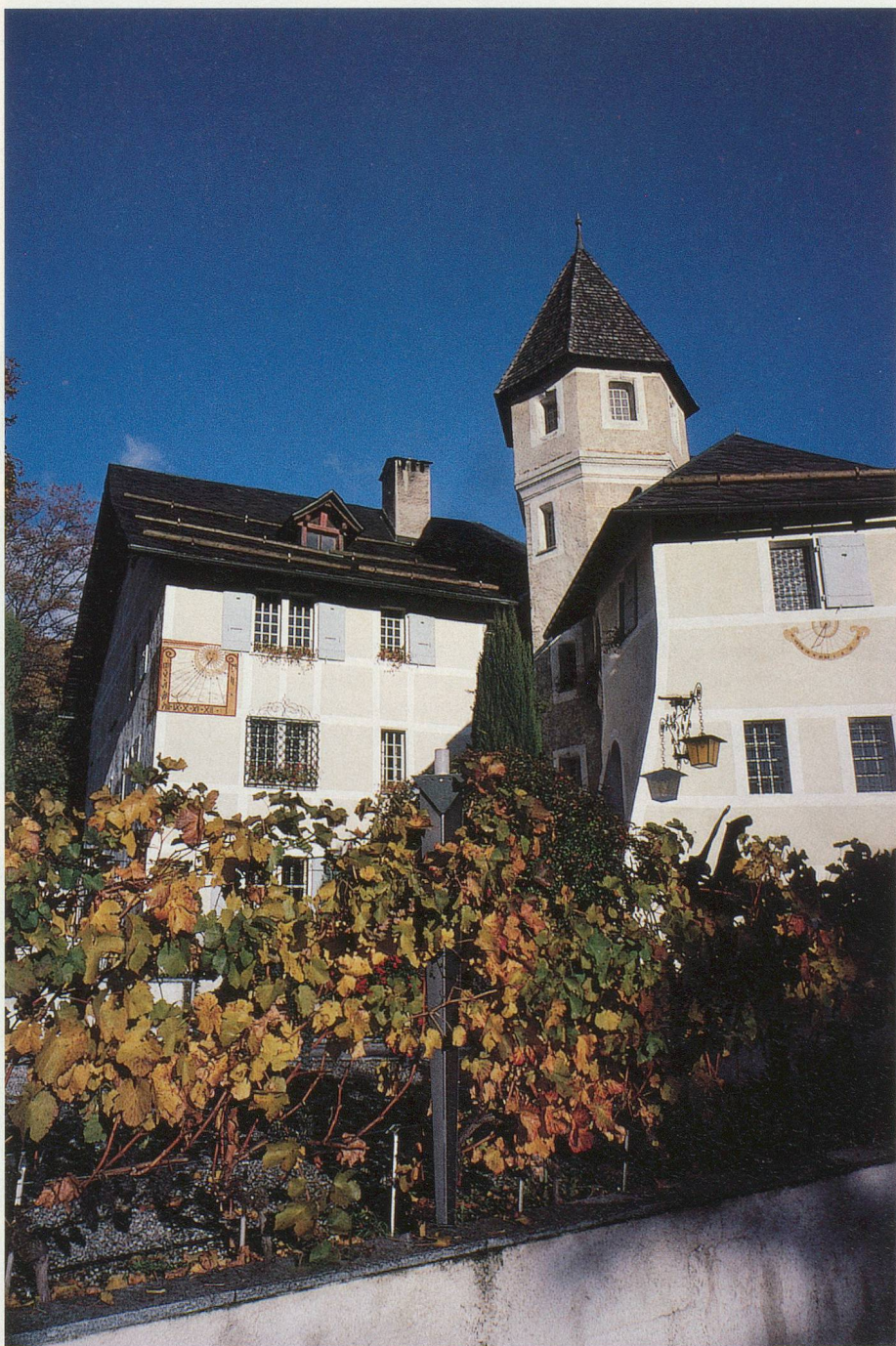
Le Château de Villa, centre culturel de la vigne, à Sierre

Le vallon de la Raspille, dont les eaux furent l'objet de litiges tranchés par le prince-évêque, mérite bien le détour à la découverte de ses pyramides, de ses bosquets de chênes pubescents et de pins sylvestres. C'est un lieu privilégié fréquenté par les papillons azurés, l'alouette lulu, la linotte, le bruant fou, le rougequeue. Et ne soyez pas effrayé par la taille du lézard vert. ▶