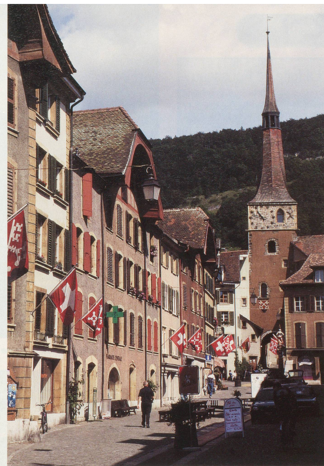
La rue du Marché, au cœur du bourg médiéval de La Neuveville

Dans cette région, où la frontière linguistique est parfois floue, de nombreux villages arborent leur nom en français et en allemand. C'est ainsi que l'on trouve Cerlier (Erlach), Chavannes (Schafis), Gléresse (Ligerz), Douanne (Twann) et Daucher (Tüscherz). On n'utilise plus guère Neuenstadt pour La Neuveville, mais il vaut mieux savoir que le canal de la Thielle se dit Zihlkanal et l'île Saint-Pierre St. Peterinsel.