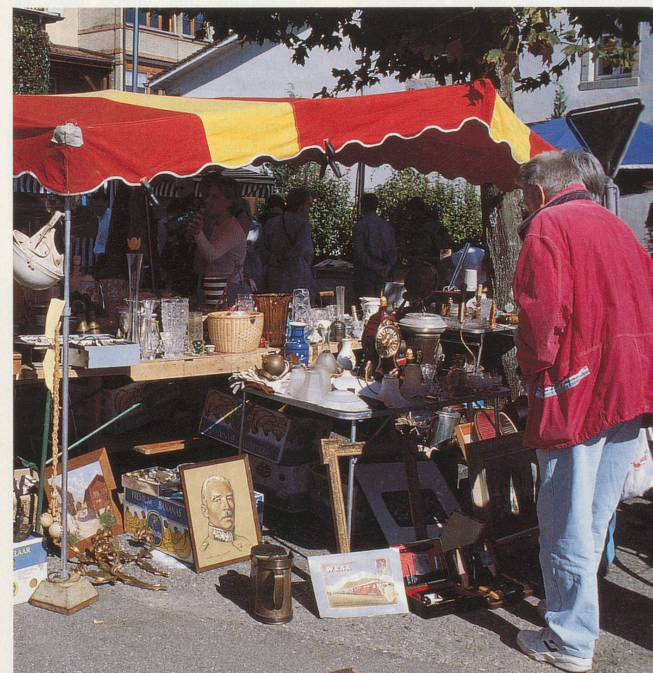
La brocante du Landeron est la plus importante du pays