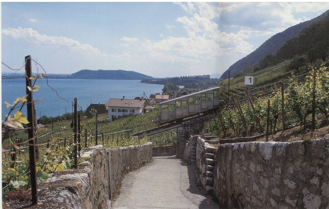
Le sentier didactique va de Gléresse à Douanne

Autrefois, les habitants de La Neuveville appartenaient à trois confréries: les pêcheurs, les escoffiers (cordonniers) et les vignolants. Puis apparurent