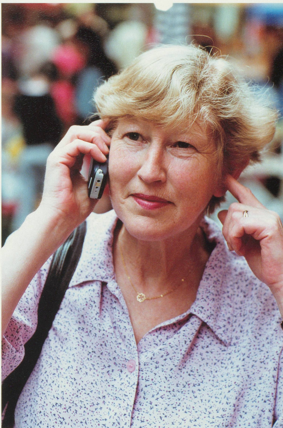
Pas toujours facile d'entendre et de se faire comprendre

Par la suite, si vous êtes curieux, vous pourrez apprendre à changer la sonnerie du téléphone (il y a au moins une dizaine de mélodies pré-enregistrées dans votre appareil), à composer des messages écrits (SMS) et à lire ceux que vous avez reçus,