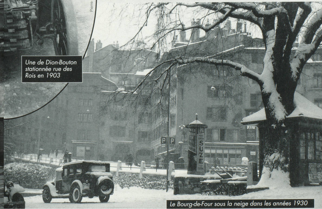
Le Bourg-de-Four sous la neige dans les années 1930