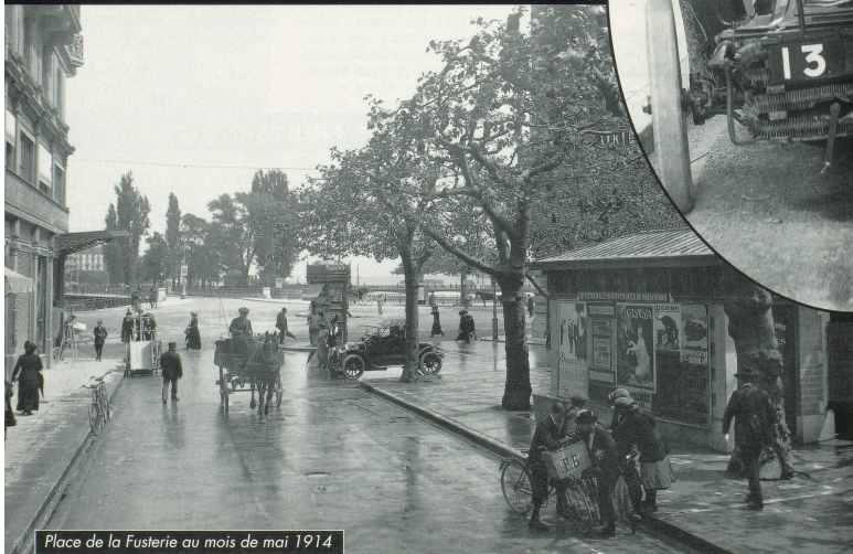
Place de la Fusterie au mois de mai 1914