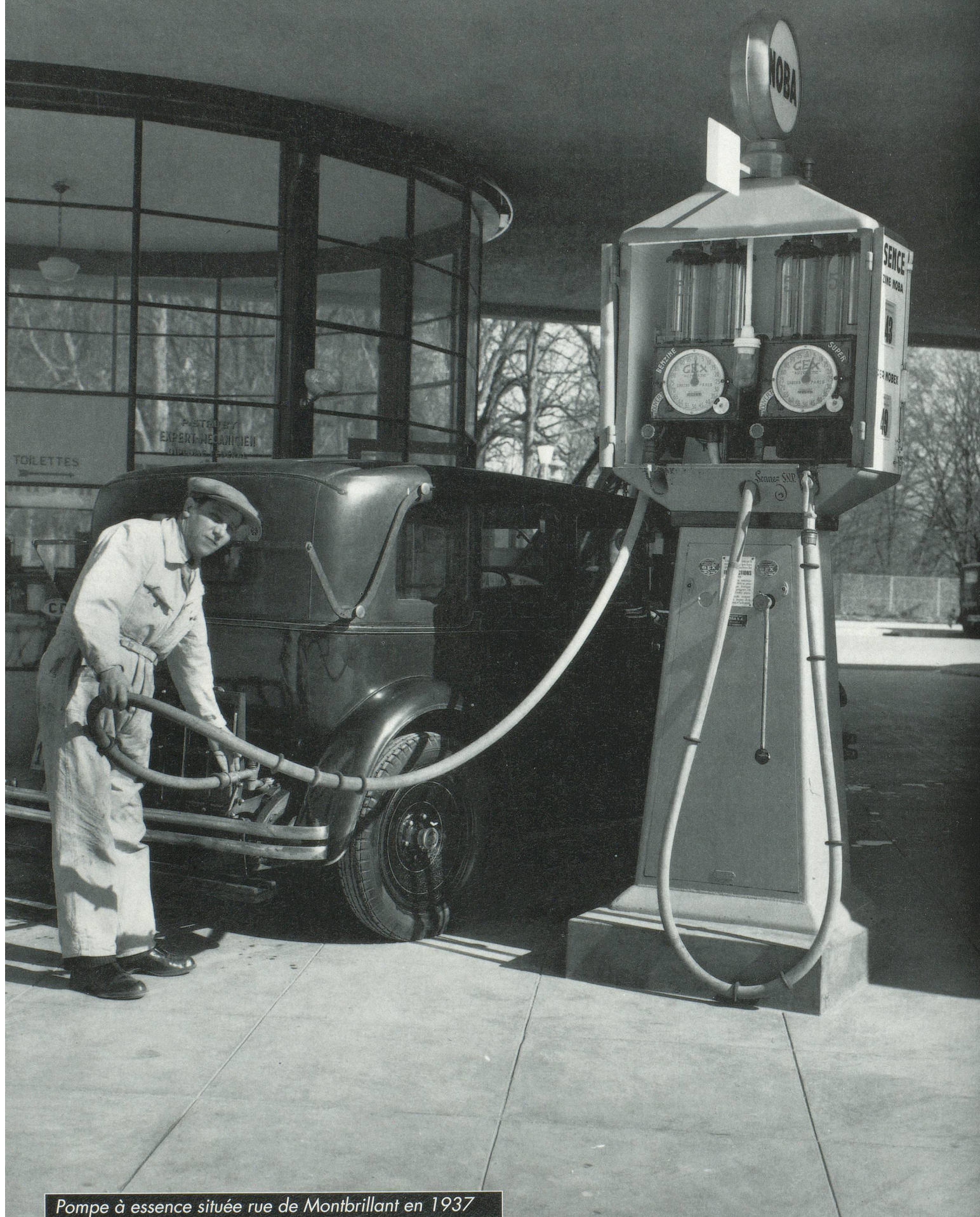
Pompe à essence située rue de Montbrillant en 1937