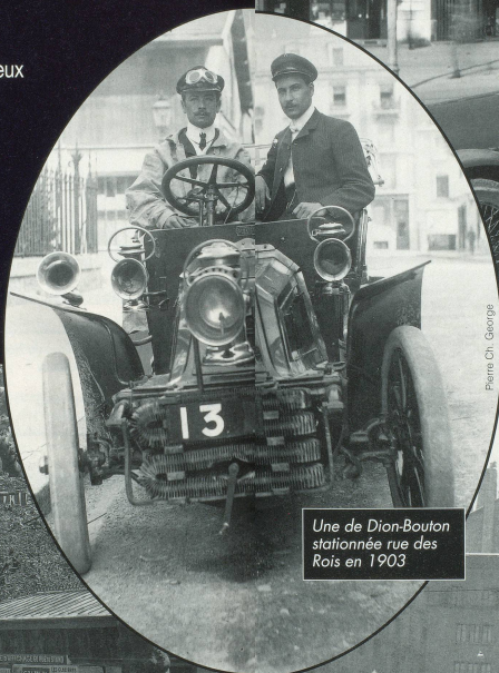
Une de Dion-Bouton stationnée rue des Rois en 1903

Epoque et, tout récemment, Circulez, Genevois, y'a tout à voir! «Enfant, lorsque j'allais en vacances chez ma grand-mère, je passais des journées entières à parcourir les albums de cartes postales et à déchiffrer la correspondance que s'échangeaient mes aïeux durant leurs longues fiançailles.» Au décès de sa ▶