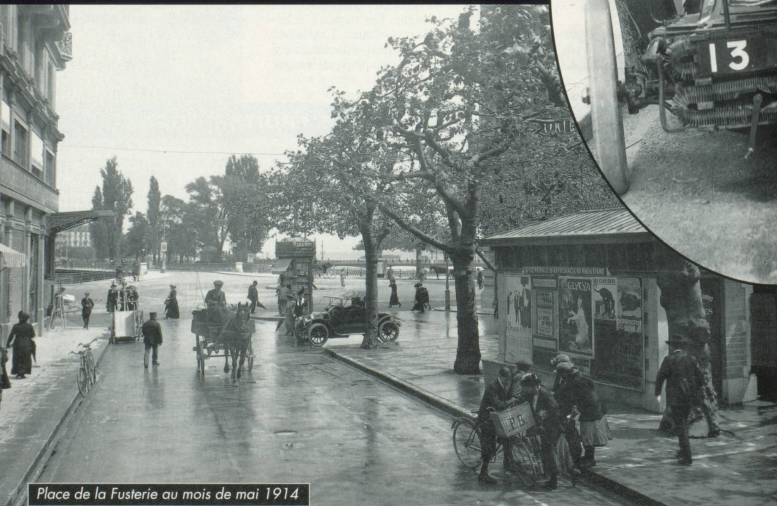
Place de la Fusterie au mois de mai 1914