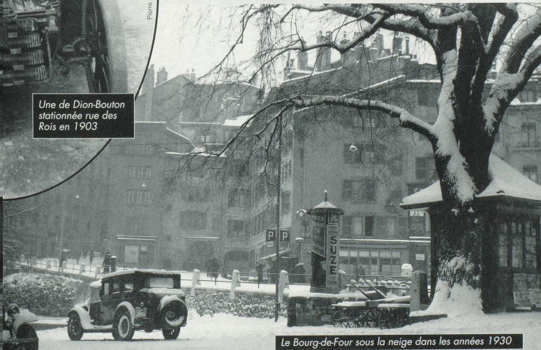
Le Bourg-de-Four sous la neige dans les années 1930