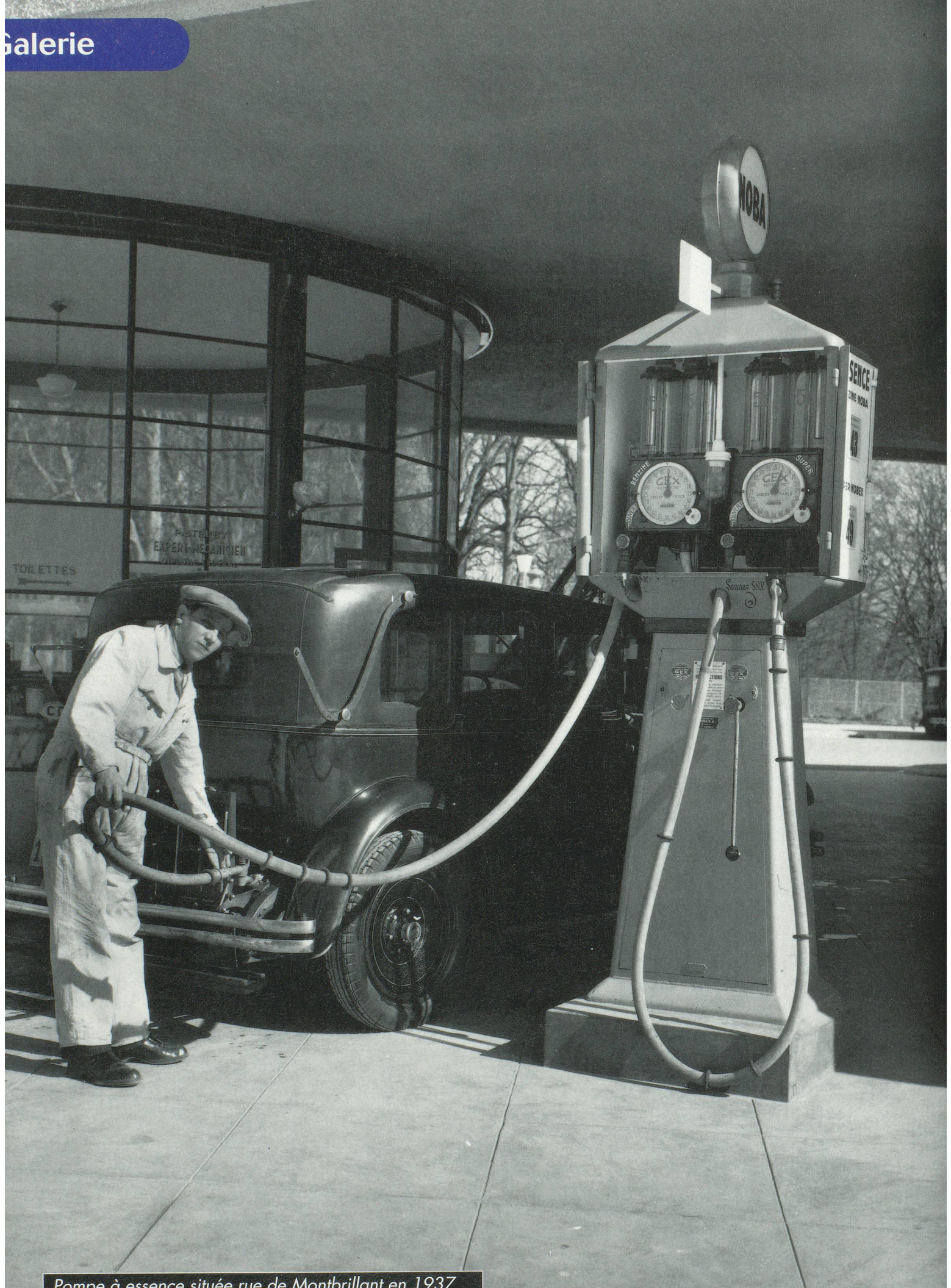
Pompe à essence située rue de Montbrillant en 1937