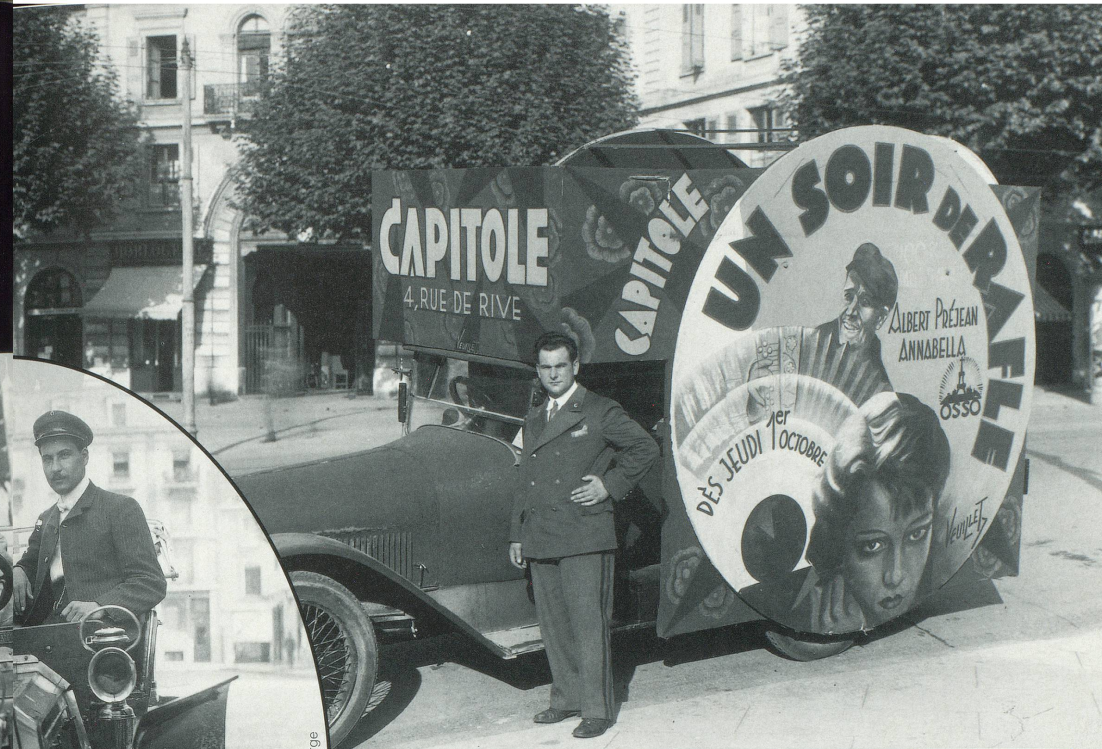
Voiture publicitaire pour le cinéma Capitole au rond-point de Rive en 1931