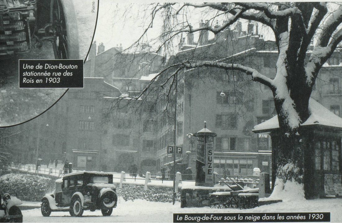
Le Bourg-de-Four sous la neige dans les années 1930