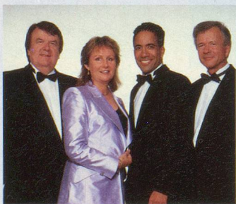
Alain Morisod et Sweet People

Inclus dans le prix: transfert par TGV Genève-Cannes et retour, billet CFF dès votre domicile, hébergement en cabine double, cocktail du commandant, pension complète, boissons comprises, dîner de gala, animations, sports, accompagnant au départ de Suisse. (Non compris: assurance annulation, boissons hors des repas, excursions facultatives, dépenses personnelles, taxes portuaires).