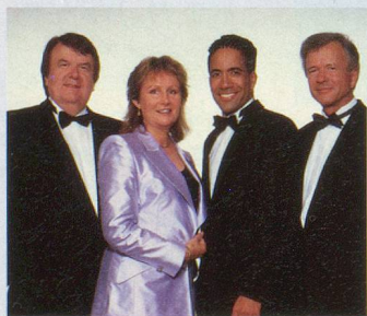
Alain Morisod et Sweet People

Inclus dans le prix: transfert par TGV Genève-Cannes et retour, billet CFF dès votre domicile, hébergement en cabine double, cocktail du commandant, pension complète, boissons comprises, dîner de gala, animations, sports, accompagnant au départ de Suisse. (Non compris: assurance annulation, boissons hors des repas, excursions facultatives, dépenses personnelles, taxes portuaires).