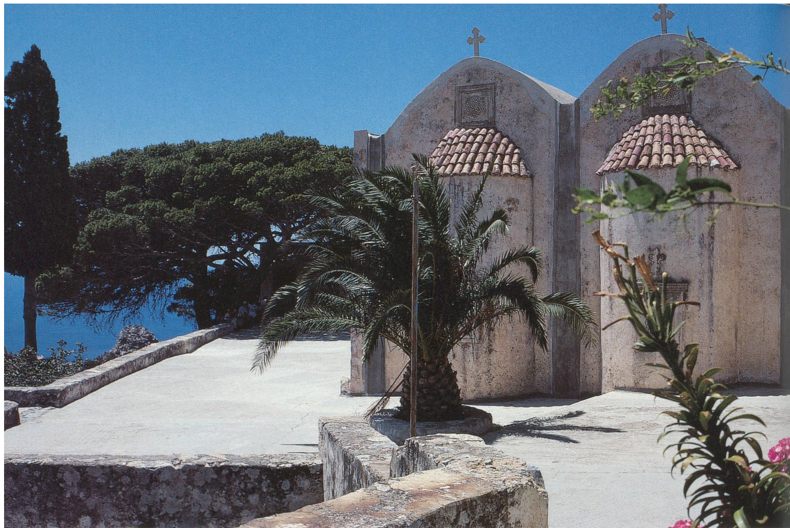
Le monastère de Preveli: silence et vie monacale au-dessus de la mer de Libye

en emporter un autre pour enrichir les nuits crétoises.