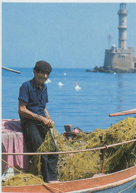
Le phare du port de La Canée, à l'ouest de l'île