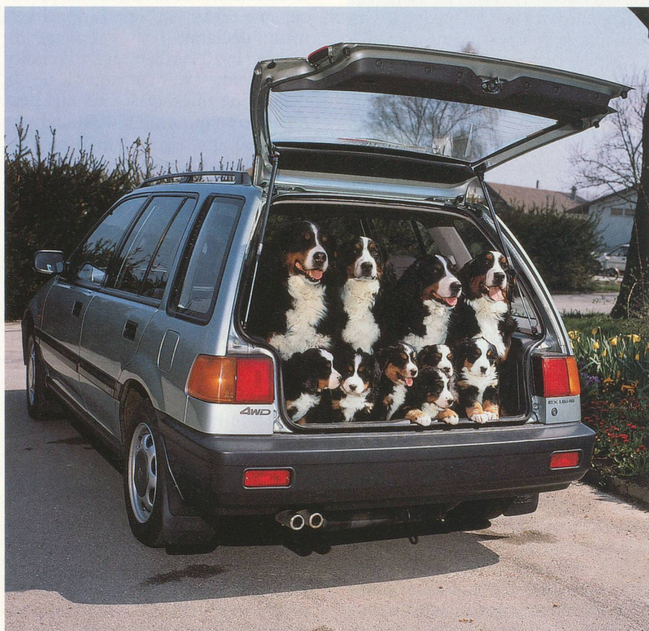
En voiture, un chien doit impérativement voyager à l'arrière

Les déplacements en voiture provoquent parfois une grande anxiété chez les quadrupèdes. Pour pallier des comportements incontrôlables, il y a lieu de placer son chat dans une cage de transport et son chien à l'arrière de la voiture, derrière un filet de séparation. Si l'angoisse de l'animal est trop forte, la seule solution est de lui administrer un tranquilli-